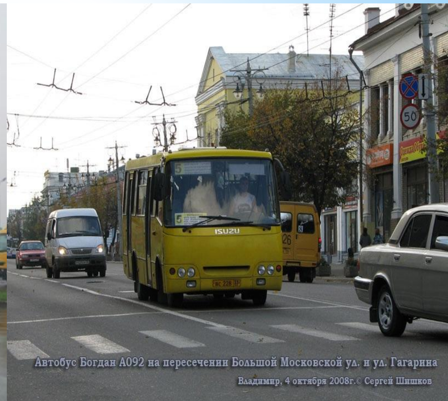
Автобус Богдан А092 на пересечении Большой Московской ул. и ул. Гагарина

Владимир, 4 октября 2008г.