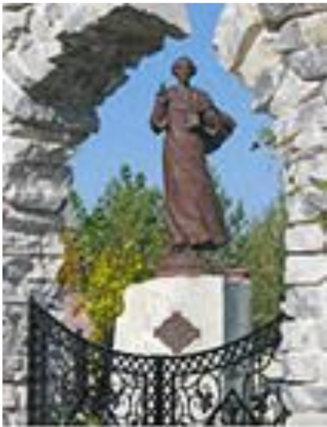
Памятник известной Айской Еврейской ... 1911 г. в Златоусте (1911 г.)