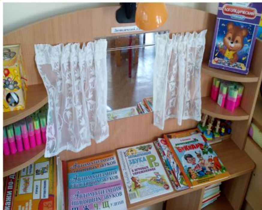
Речевые уголки в группах