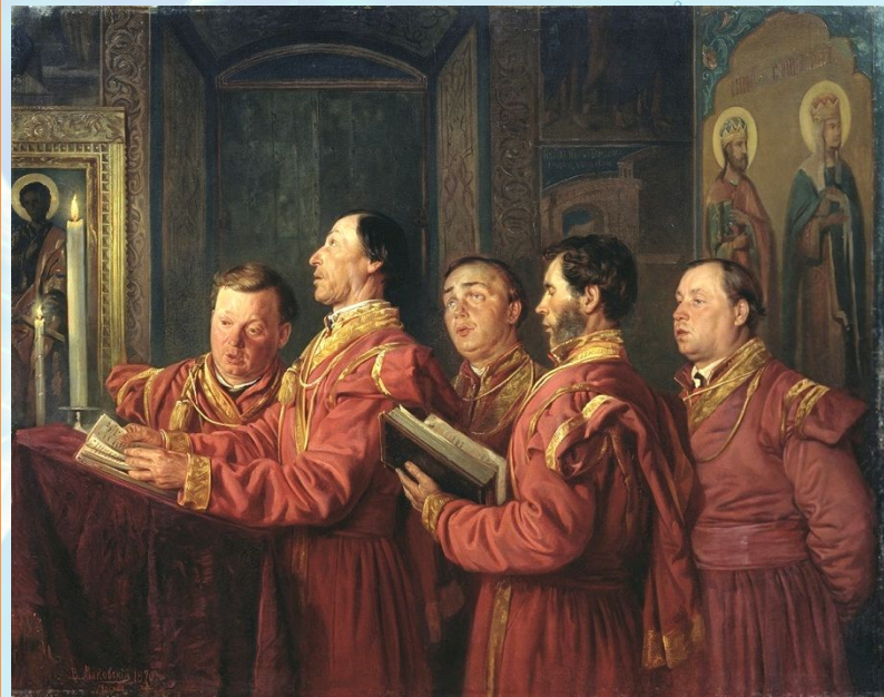
В. Маковский «Певчие на клиросе»

ДО XV, А В ЦЕРКОВНОМ ПЕСНОПЕНИИ — ДО XVII ВЕКА, В ХОРЕ СОСТОЯЛИ ТОЛЬКО МУЖЧИНЫ.