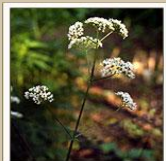
Валериана лекарственная Valeriana officinalis L.

Травянистое растение, до 2 см высотой, корневище короткое, длиной 2–4 см и толщиной до 2 см, вертикальное, внутри полое, с многочисленными придаточными корнями бурой или светло-кремовой окраски, с сильным своеобразным запахом.