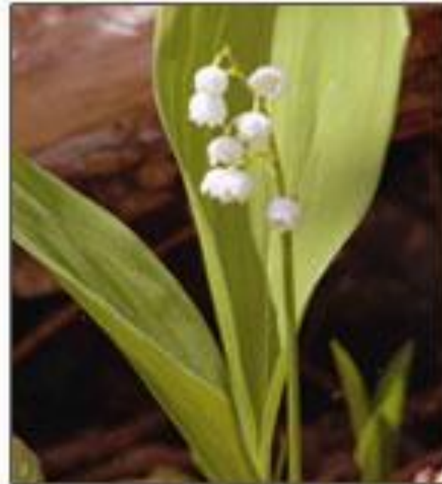
Ландыш майский Convallaria majalis L.