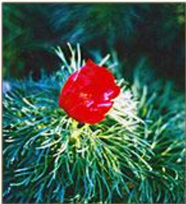
Пион узколистный Paeonia tenuifolia L.