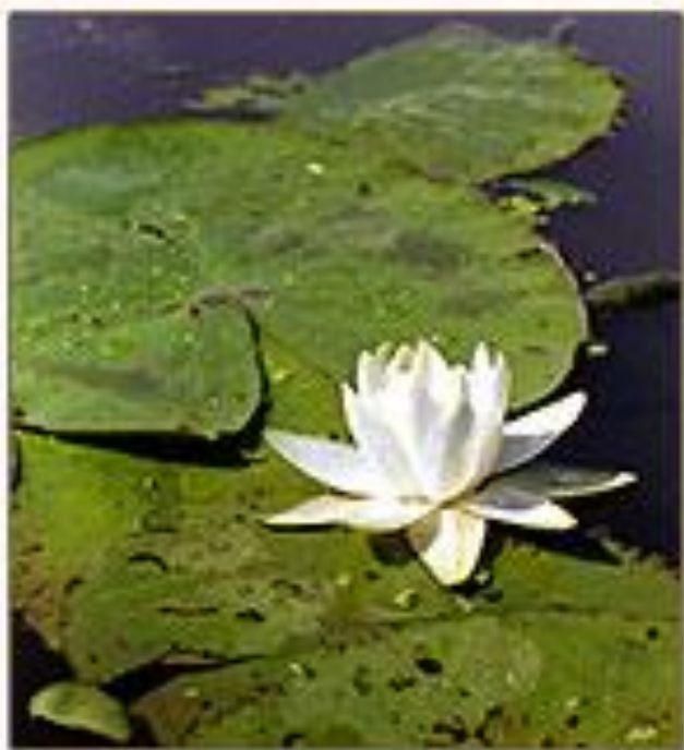
Кувшинка белая Nymphaea alba L.