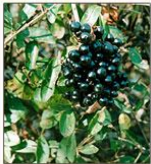
Бирючина обыкновенная Ligustrum vulgare L.