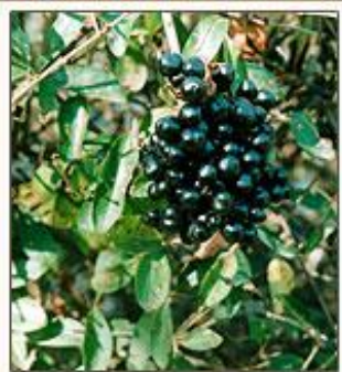
Бирючина обыкновенная Ligustrum vulgare L.