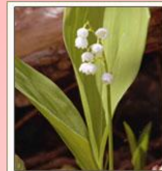
Ландыш майский Convallaria majalis L.

Латинское название произошло от лат. convallis – долина (по местообитанию). В дословном переводе означает "лилия долин, цветущая в мае". Вода, где стояли ландыши, становится ядовитой.