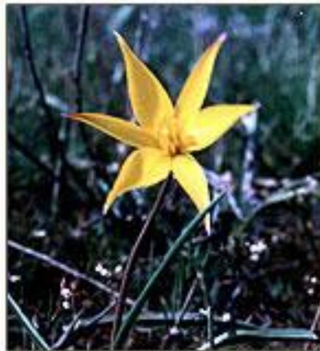
Тюльпан Биберштейна Tulipa biebersteiniana Schult. et Schult. fil.

Растение 20–40 см высотой. Стебель чаще с 2-3 листьями. Листья узколинейно-ланцетные, 5–20 мм шириной. Цветки обычно одиночные.