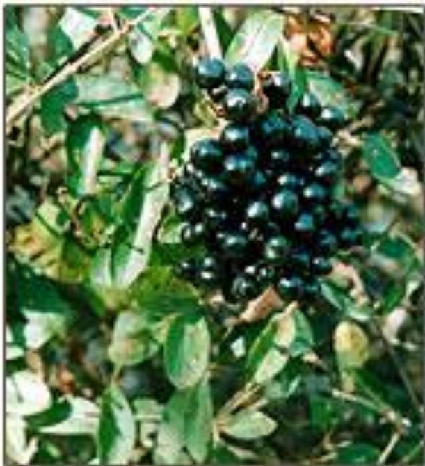
Бирючина обыкновенная Ligustrum vulgare L.