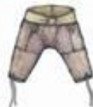
Штаны мужские, меховые