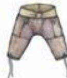
Штаны мужские, меховые