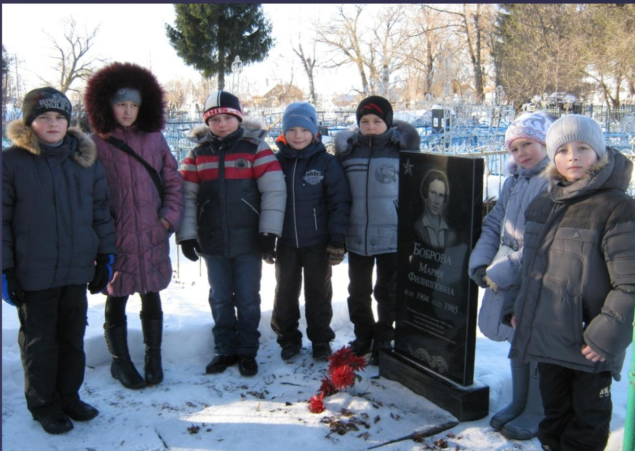
У памятника М.Ф. Бобровой 30.12.12.