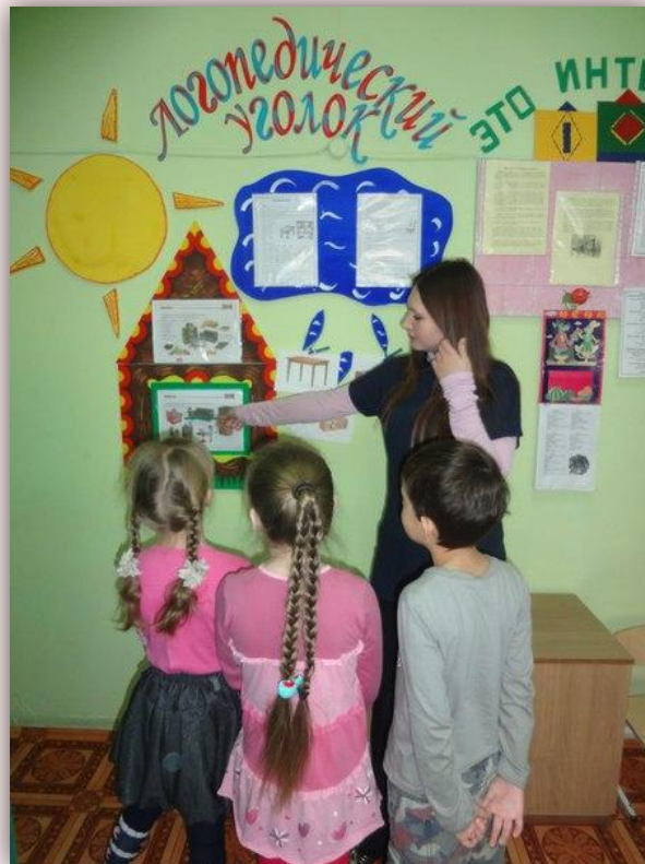
Логопедический уголок в группе