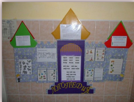
Логопедический стенд для родителей и детей