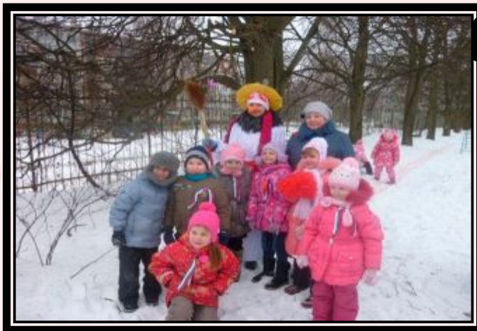
Олимпийские игры в детском саду