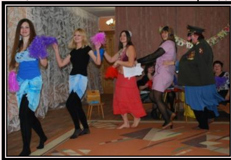
Юбилей детского сада