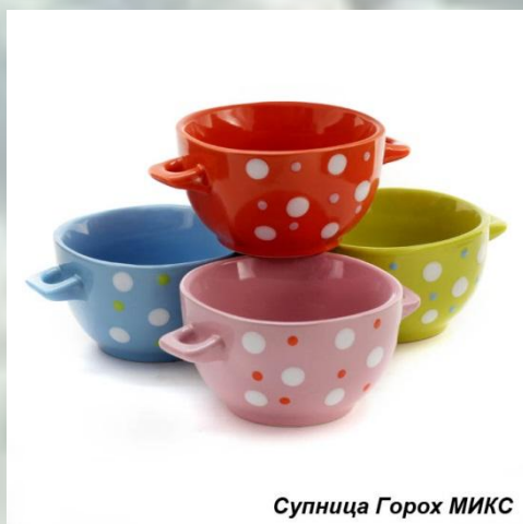
Супница Горох МИКС