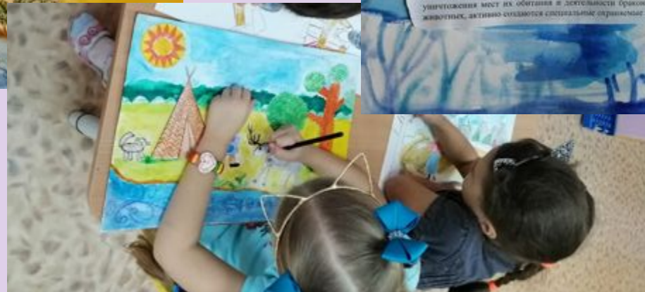
Муниципальное детское дошкольное образовательное учреждение комбинированного вида «Радуга» г. Югорск Метельна Мелна 4 год Название работы: «Северный олень» Рис. Елена Евгеньевна Васильева

В последнее время количество диких северных оленей уменьшилось из-за уничтожения мест их обитания и деятельности браконьеров, поэтому, для защиты этих животных, активно создаются специальные охраняемые заповедники.