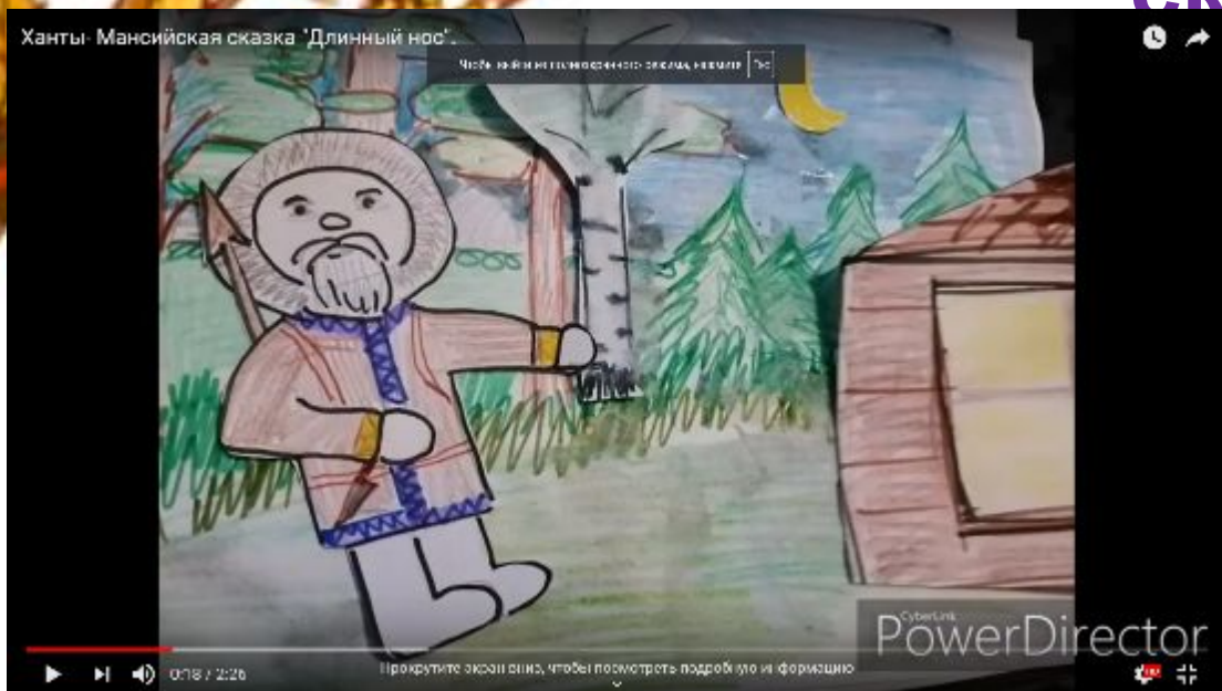
Сказка «Длинный нос».