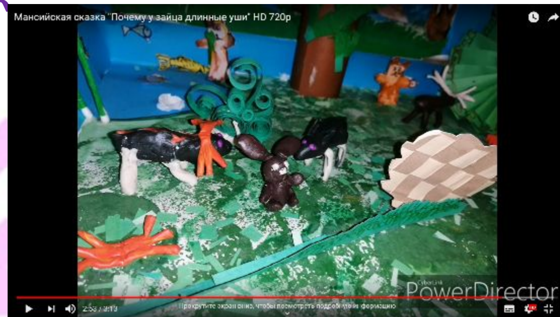
Сказка «Отчего у зайца длинные уши».