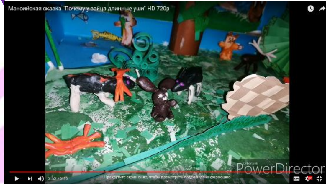
Сказка «Отчего у зайца длинные уши».