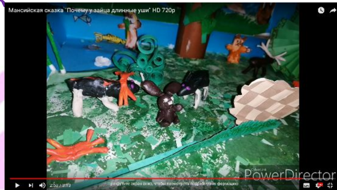
Сказка «Отчего у зайца длинные уши».