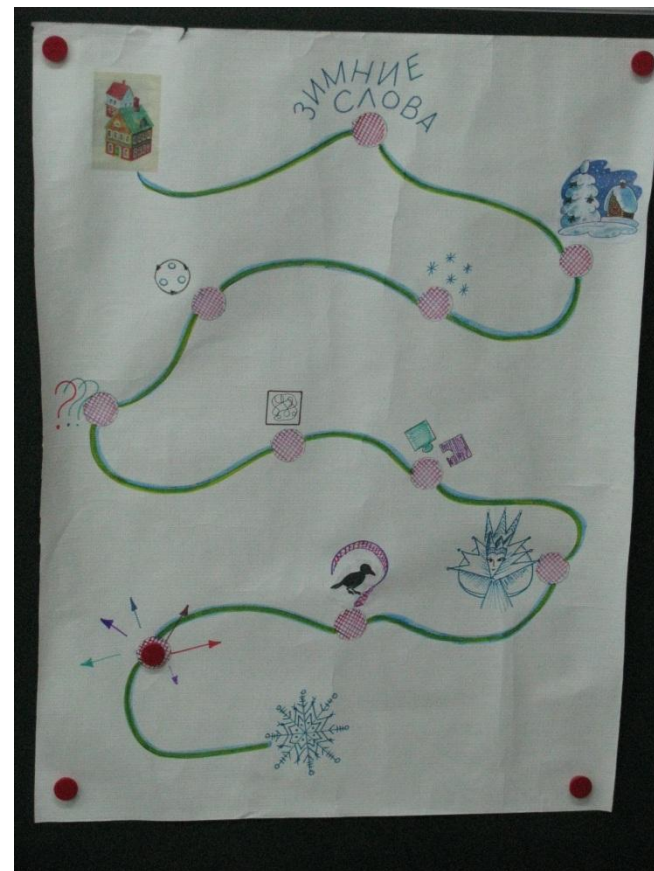
Схема предстоящего «путешествия»

разучивание стихотворения, занятия по теме «Зима», подготовка одного из родителей к роли Королевы-Снежинки, оформление помещения в соответствии с тематикой занятия, обучение разгадыванию ребусов, проведение конкурса на лучшую новогоднюю композицию, разучивание танца Снежинок, накануне занятия – получение «письма» от Королевы-Снежинки с приглашением в гости.