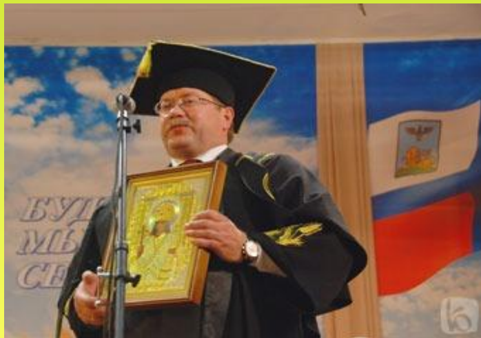
Вручение премии В.Я.Горина

И гордится земля ими отчая, Воздавая почёт по трудам, И зовут их на Белгородчине — Птенцы горинского гнезда.