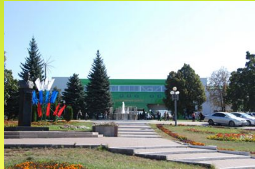
Дом культуры в Бессоновке