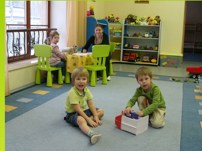
В детском саду