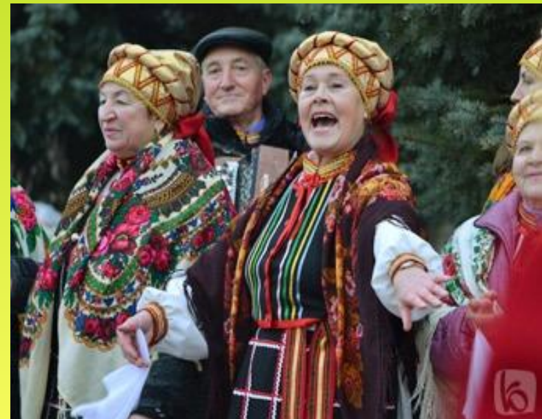
Участники художественной самодеятельности