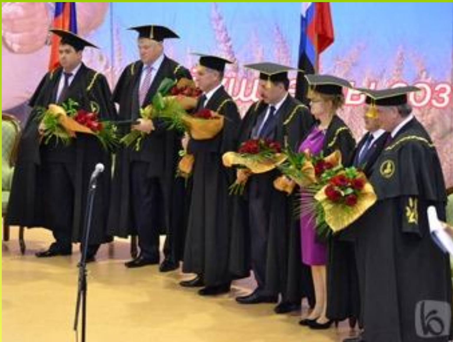
Лауреаты премии Горина В.Я., 2011 г.