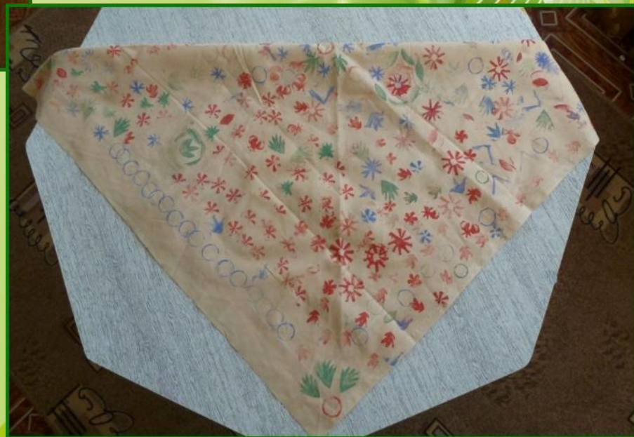
«Узорный платочек», рисование штампами