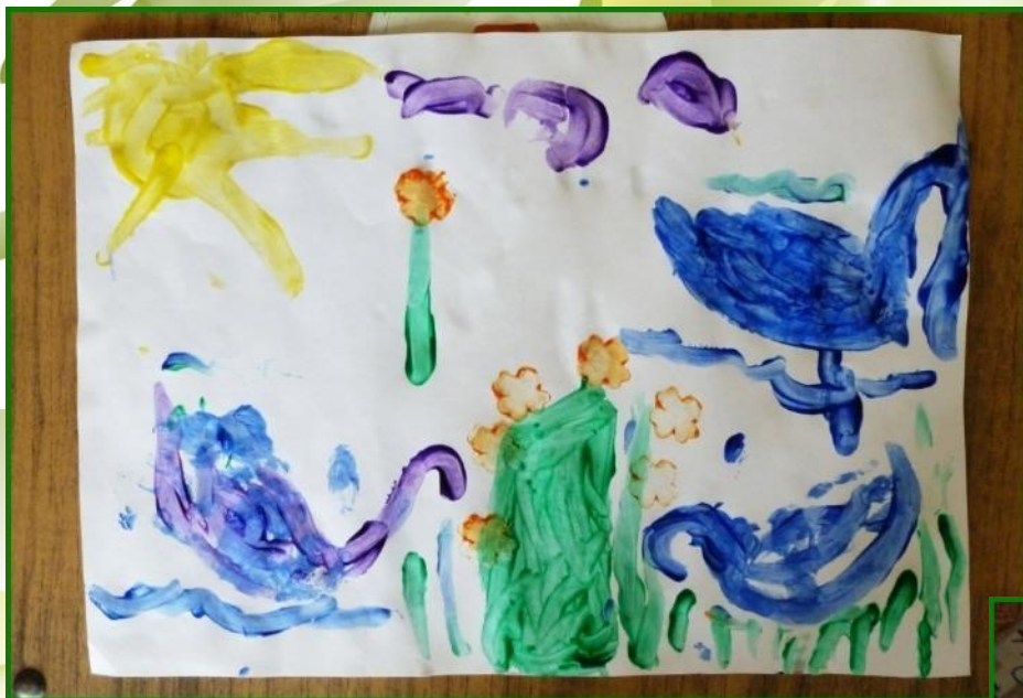
«Лебеди на озере», Рисование ладошками, пальцами