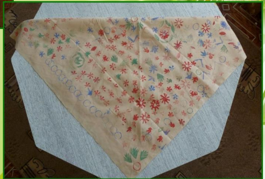
«Узорный платочек», рисование штампами