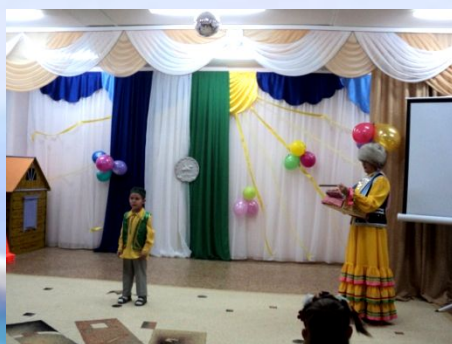
Праздник «День Республики Башкортостан»