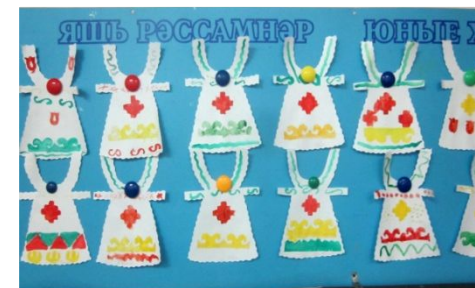
ООД «Укрась фартук»