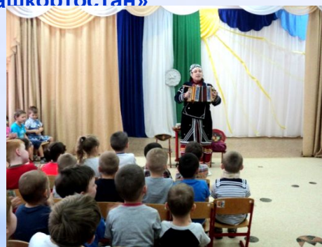
Музыкально-познавательная Композиция «Дружба народов Башкортостана»