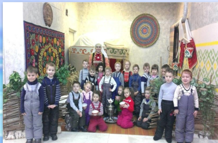
Посещение центра национальных культур