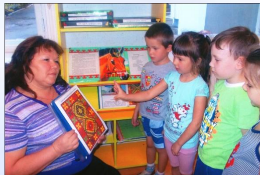
ООД «Мой край – Башкортостан»