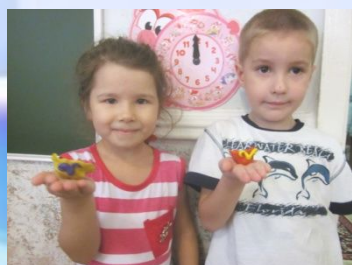
ООД «Башкирская пиала»