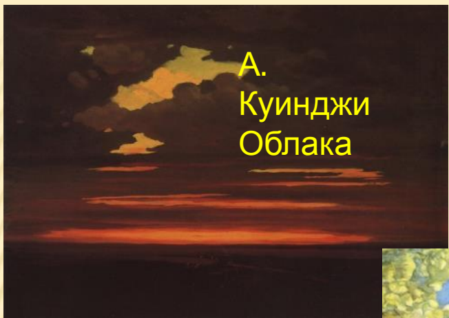
А. Куинджи Облака