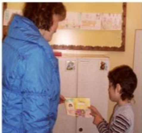
Фото репортаж «Мой любимый детский сад»

Солнце скрылось за домами, Покидаем детский сад. Я рассказываю маме Про себя и про ребят- Как мы хором песни пели, Как играли в чехарду, Что мы пили, что мы ели, Что читали в детсаду. Я рассказываю честно, И подробно обо всем. Знаю, маме интересно, Знать о том как мы живем... А теперь, моя мамуля, сможет все и увидеть!