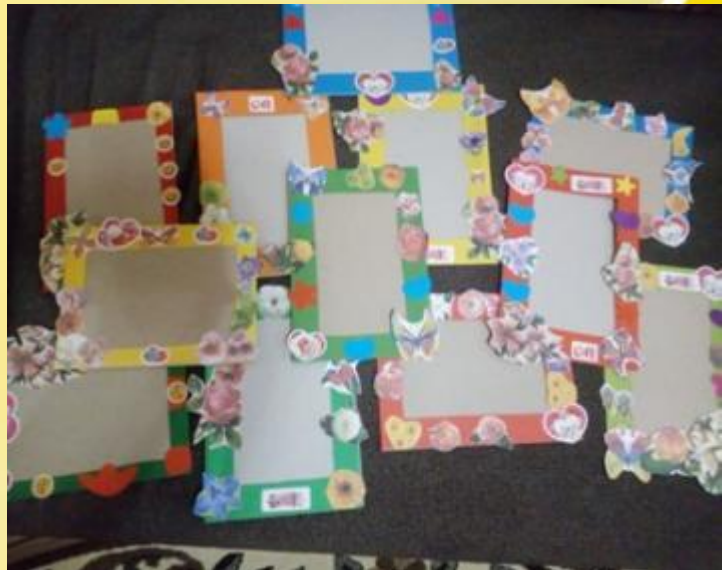
Подарок для любимой мамочки