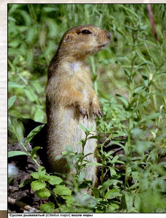
Сустенька рыжая (Стайла майор) возле норы Россия, Саратовская обл., Дзержинский р-н, июль 2004