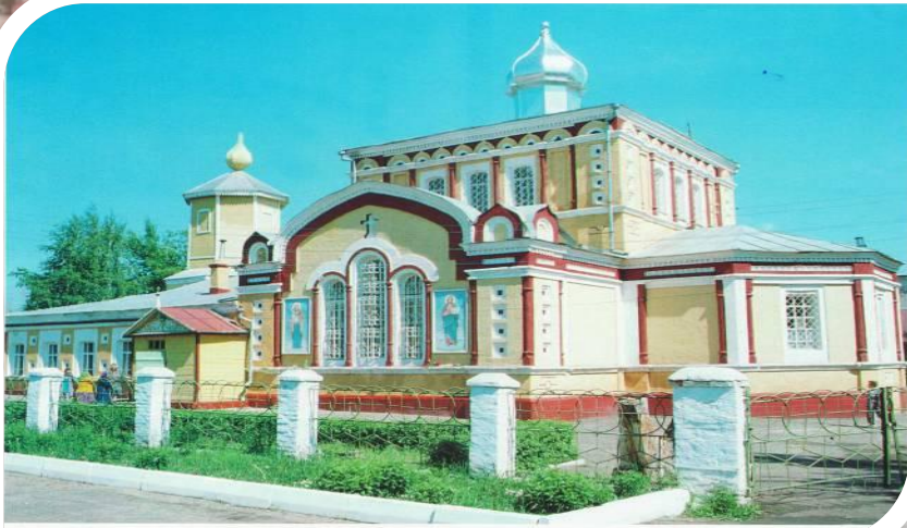
Храм Александра Невского