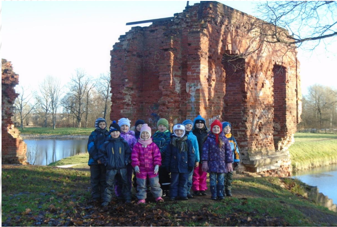
Озерковый (Розовый) павильон