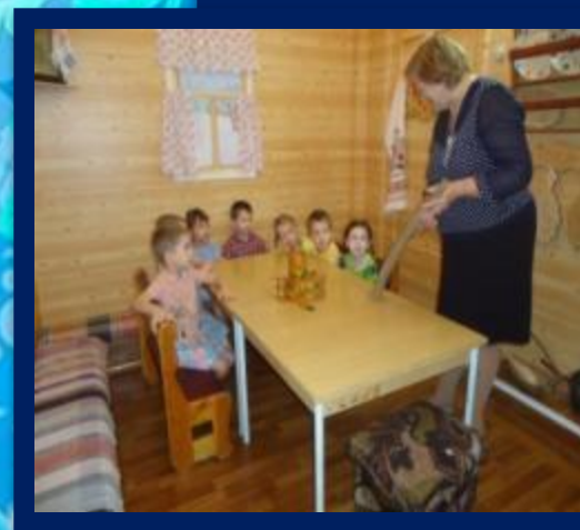
ЗНАКОМСТВО С ПРЕДМЕТАМИ БЫТА КОМИ НАРОДА В КАБИНЕТЕ «КРАЕВЕДЕНИЯ»