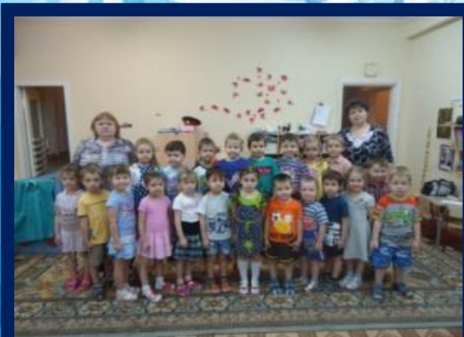
ВОСПИТАТЕЛИ И ДЕТИ