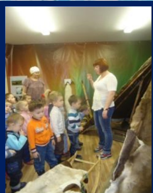
ЭКСКУРСИЯ В МУЗЕЙ