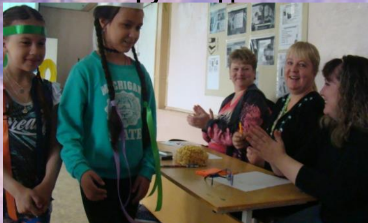
Начальник орбитальной станции «Космическая музыка» - музыкальный руководитель