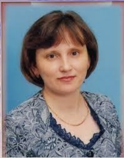
Коммандор (лорд – капитан) - директор школы