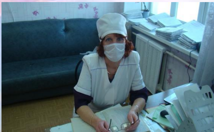
Космодоктор – медицинский работник