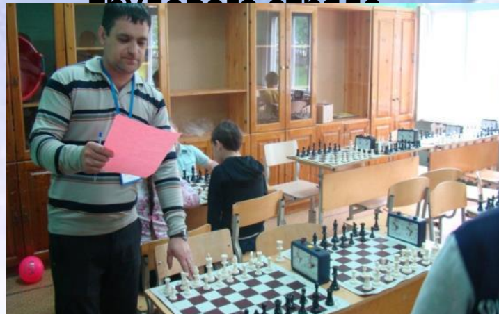
Начальник орбитальной станции «Космические шахматы» - воспитатель трудового обучения