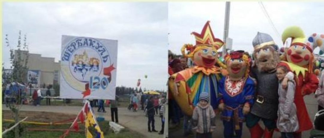
Праздник 120 – летие р. п. Шербакуль, 31.08.2013 г.