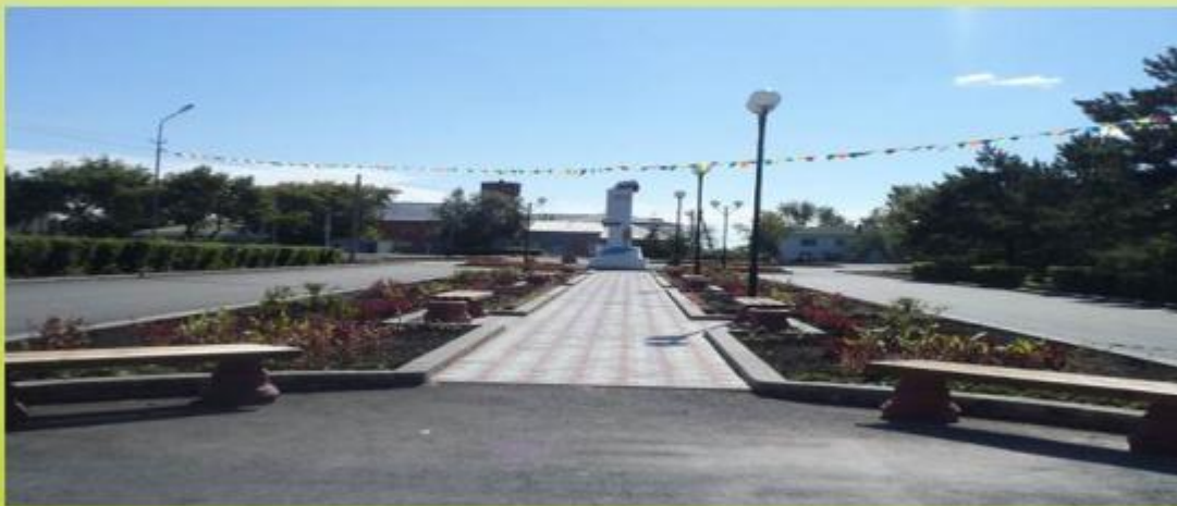
Площадь им. Л. Гуртьева, август 2013 г.