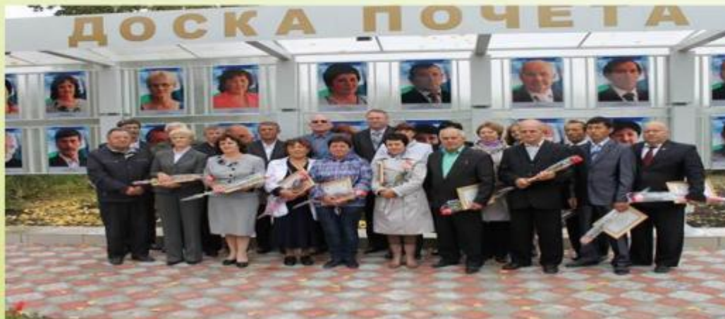
Открытие Доски Почета, 28.08. 2013 г.