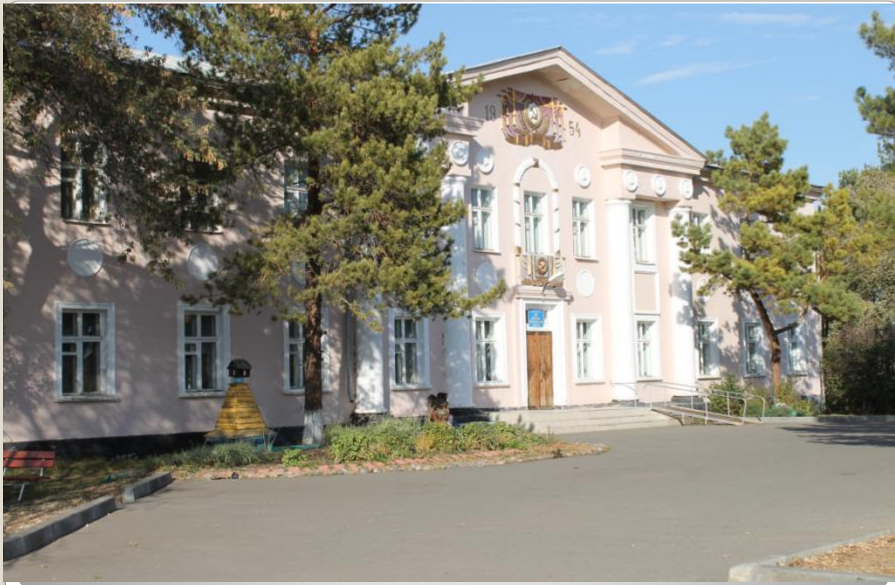
Дом детского творчества