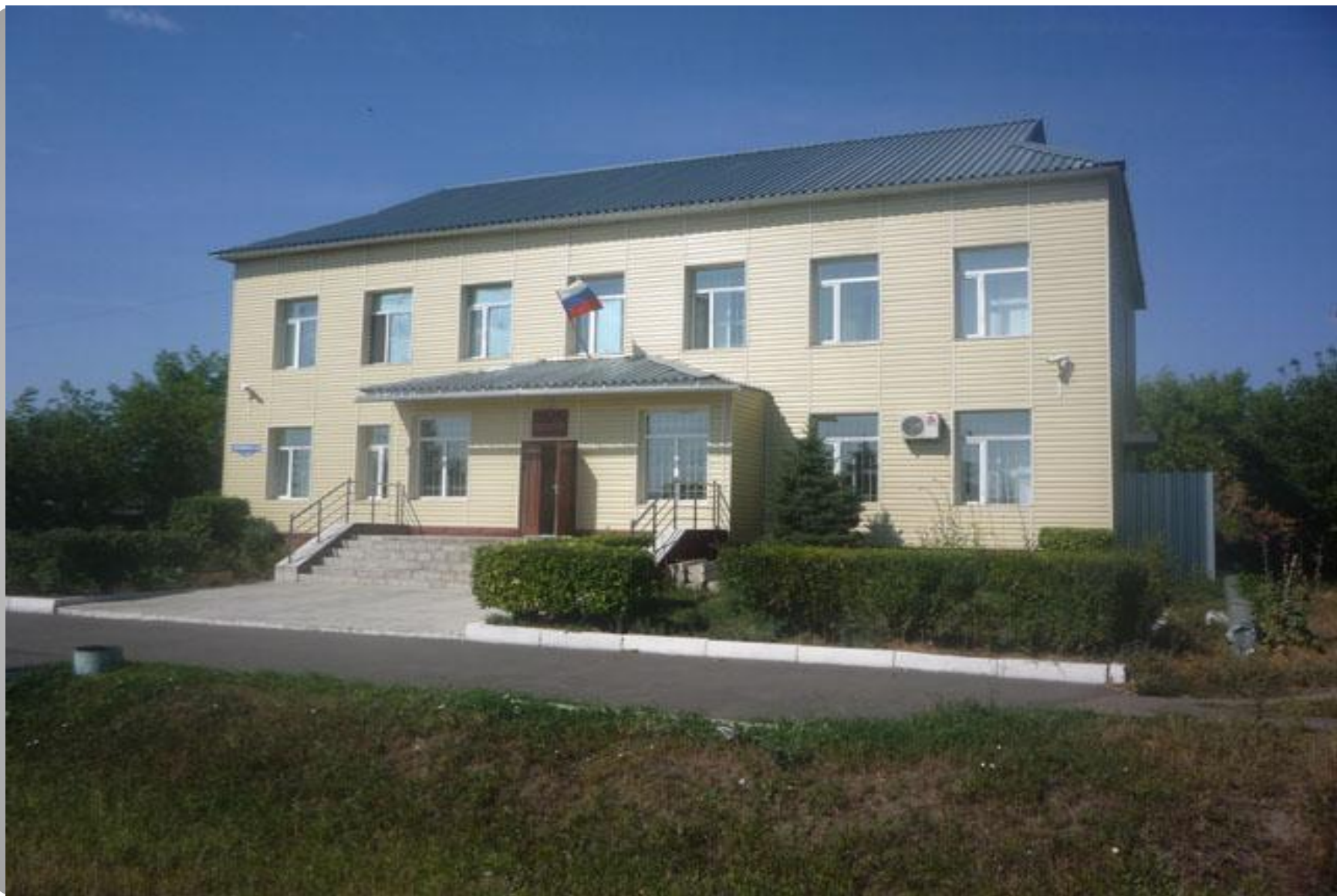
Шербакульский районный суд