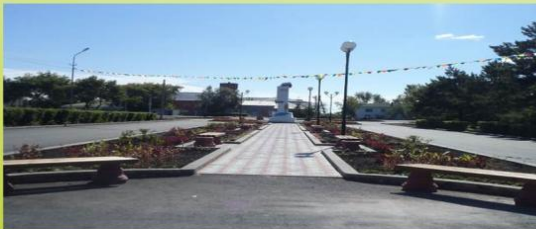
Площадь им. Л. Гуртьева, август 2013 г.