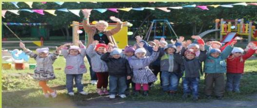
Открытие детской площадки в детском садике «Солнышко», 30.08.2013 г.