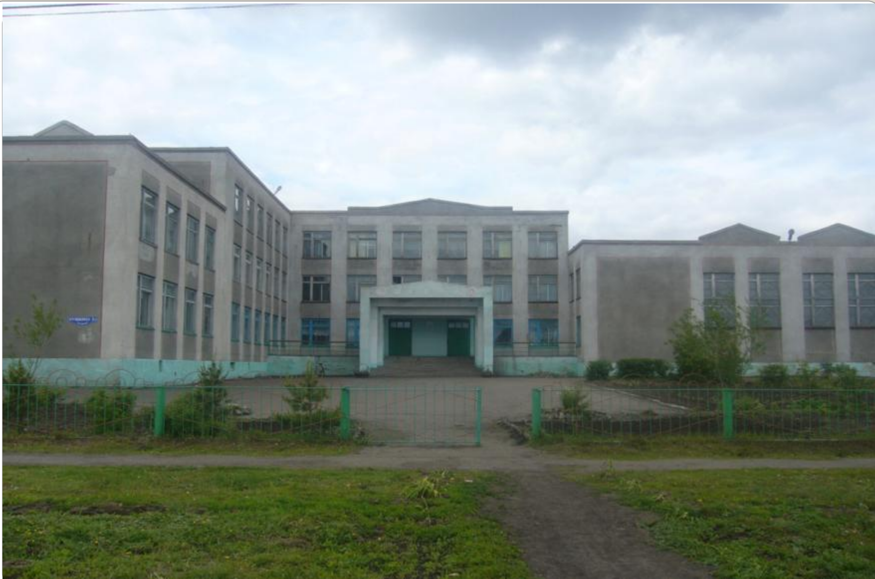
МБОУ Шербакульский лицей