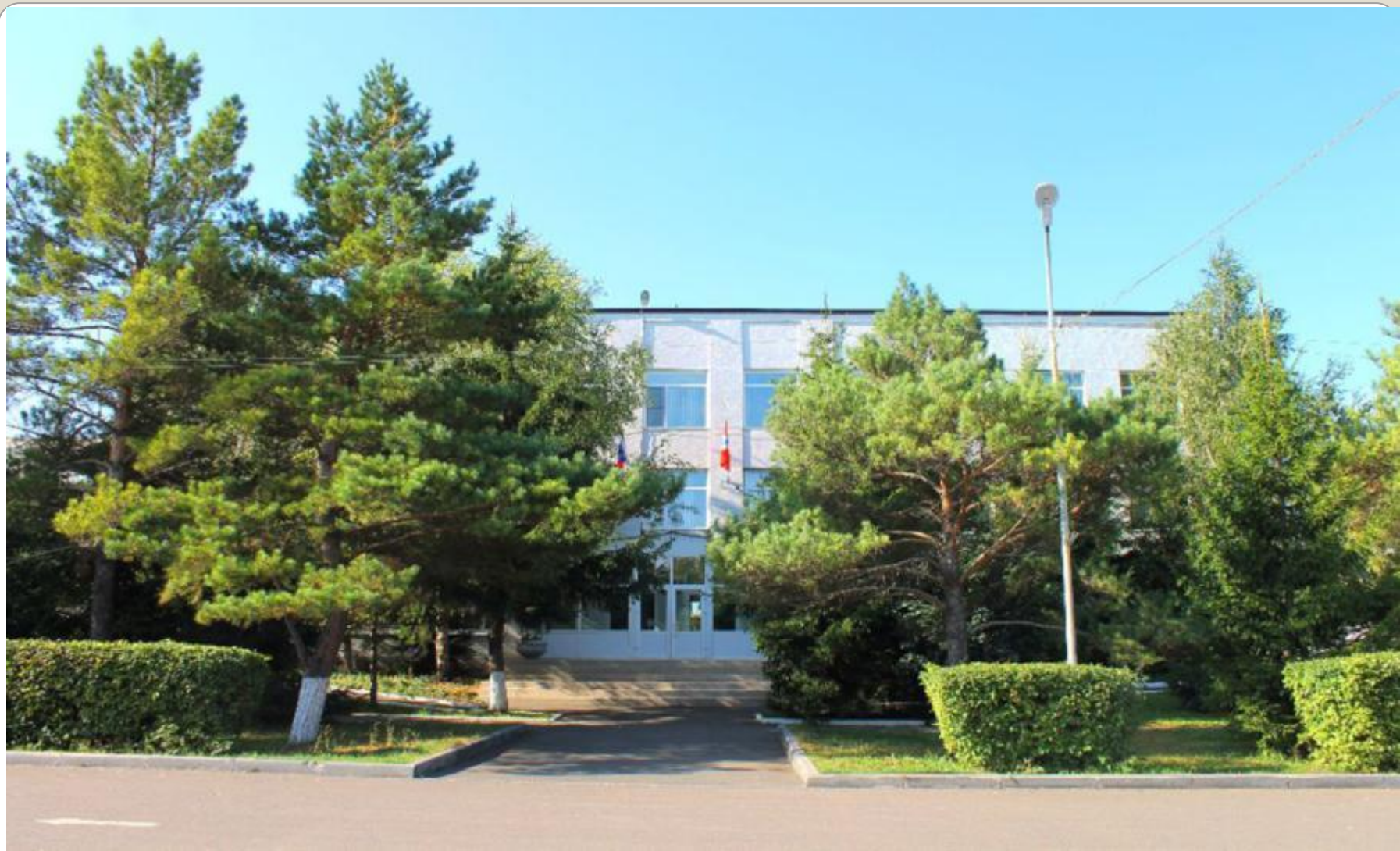
Администрация Шербакульского муниципального района