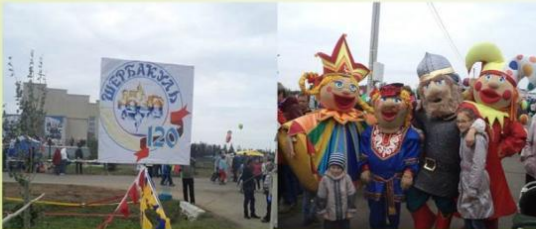
Праздник 120 – летие р. п. Шербакуль, 31.08.2013 г.