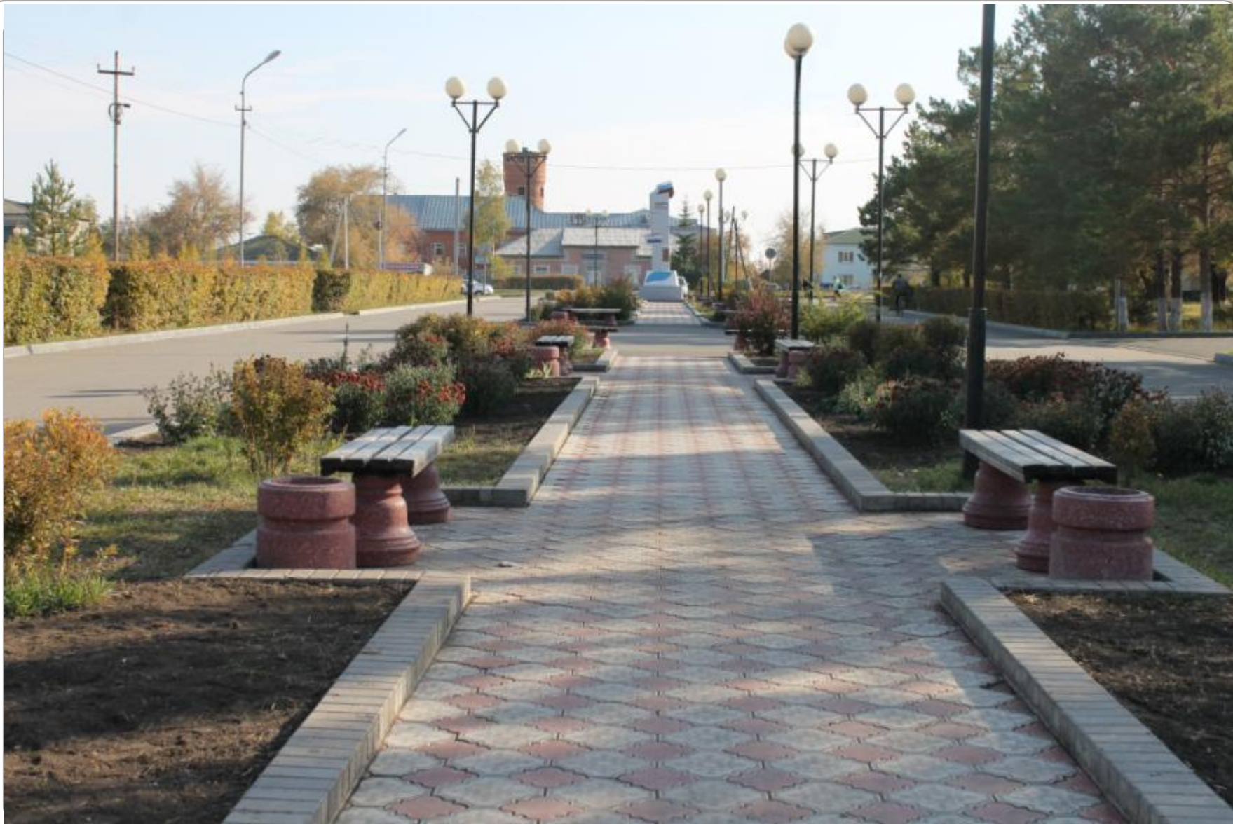
Площадь имени Гуртьева