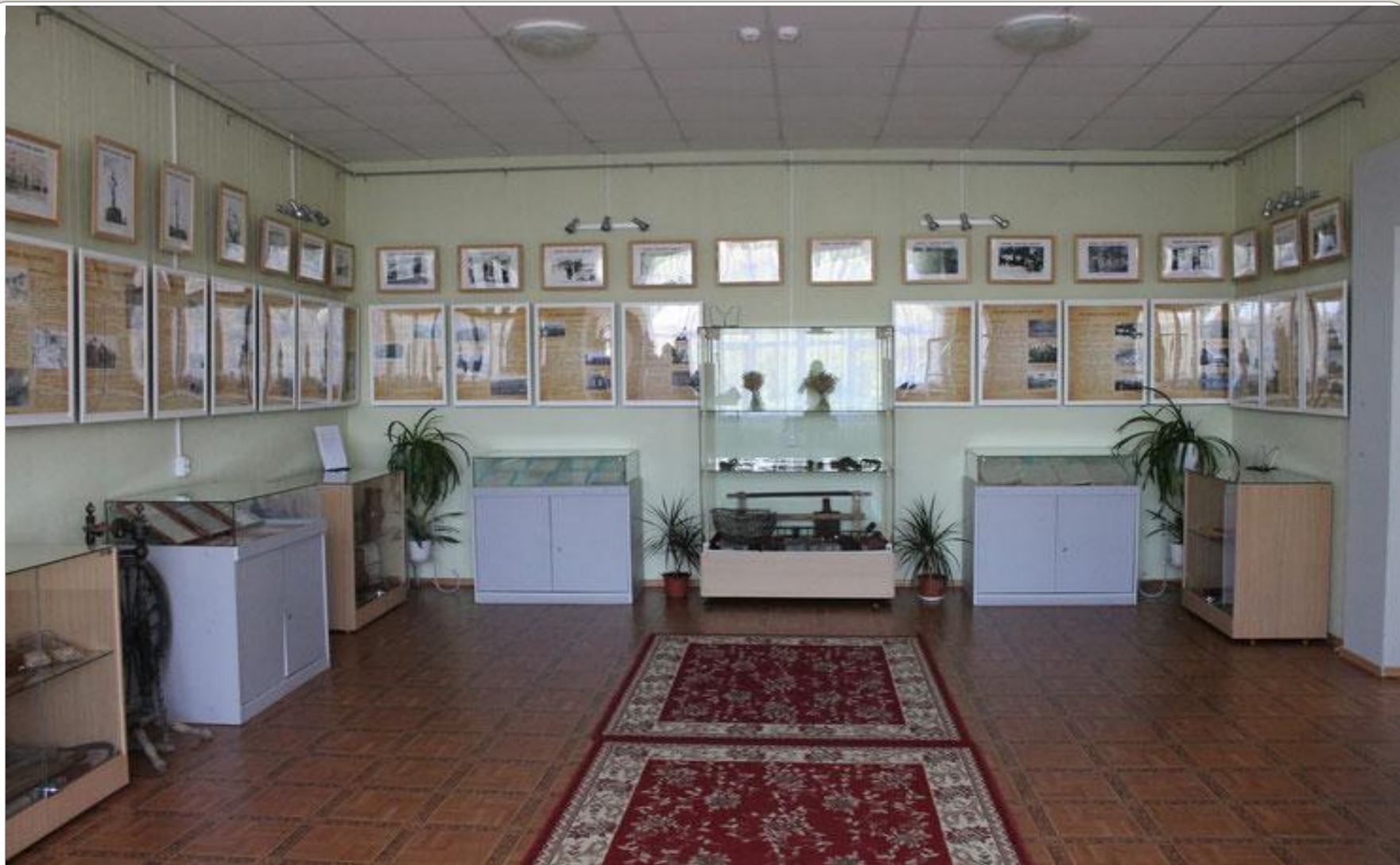
Шербакульский историко-краеведческий музей