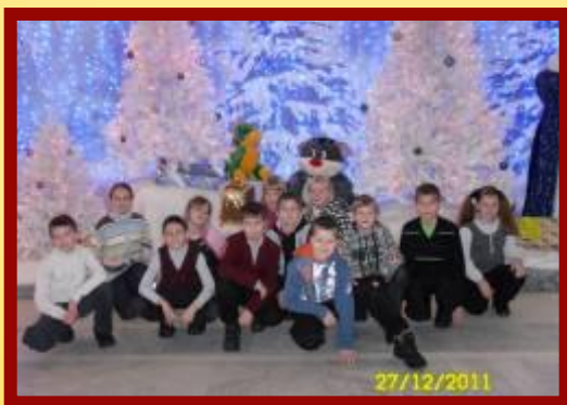
Новогоднее представление во Дворце металлургов г. Череповец