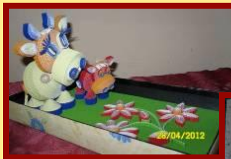
Семья Гумаровых «На лугу», квиллинг