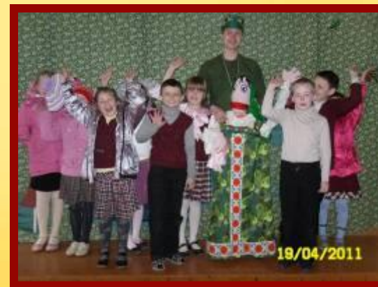
Театр ростовых кукол г. Вологда