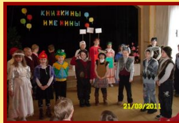
Народный театр «Чебурашка» п. Шексна