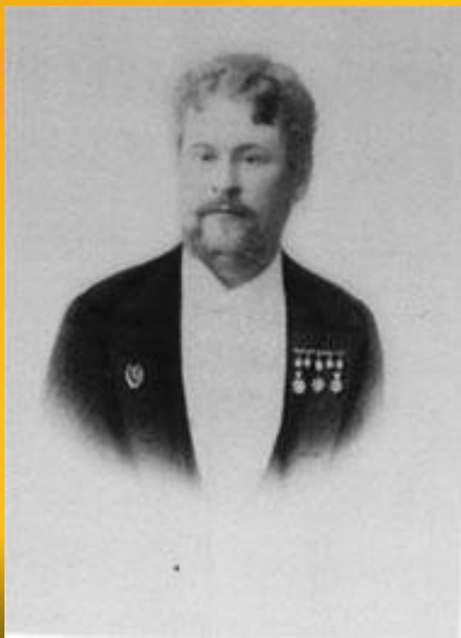
Александр Баташев (1848—1912) — один из основателей Московского зоопарка, меце-нат, основатель российского птицеводства.