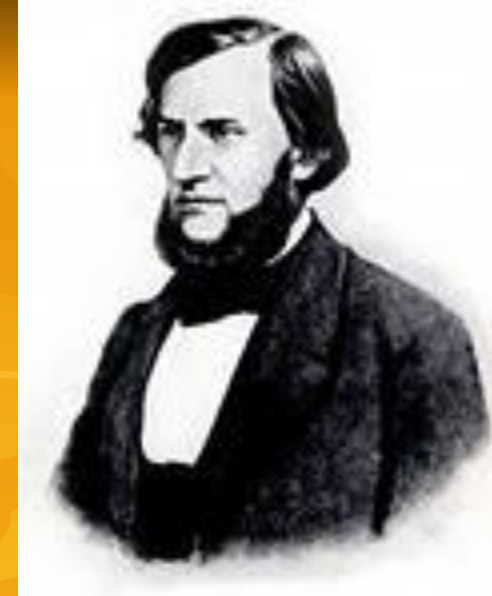
Константин Ушинский (1824—1870) — российский педагог, основоположник научной педагогики в России.