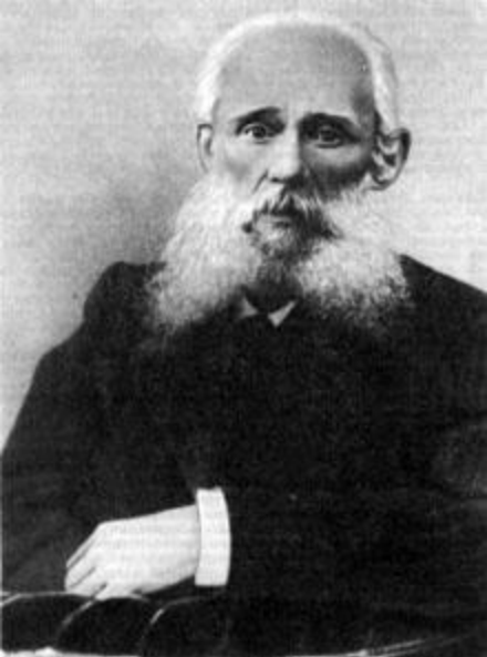
Николай Белобородов (1828—1912) — гармонист, педагог, аранжировщик, создатель хроматической гармонии, основатель первого в мире оркестра гармонистов.