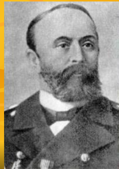
Всеволод Руднев (1855—1913) — герой русско-японской войны, контр-адмирал Флота, командир знаменитого крейсера «Варяг».