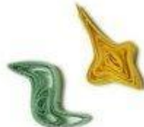
Дуга и крест