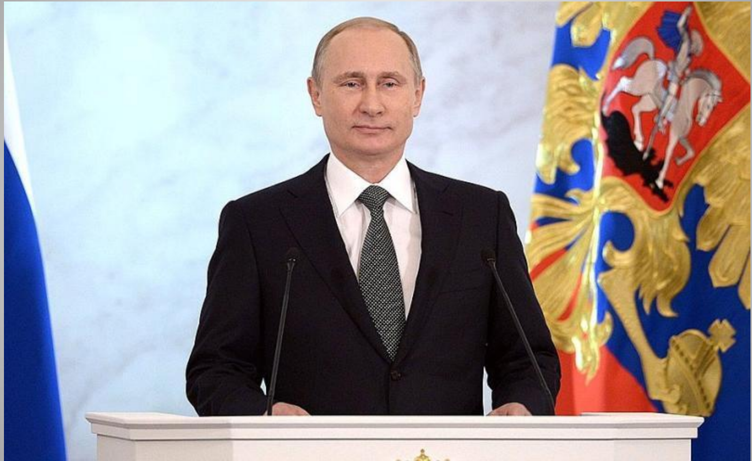
Владимир Владимирович Путин