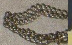
ЧАСИ КАРМАННІ учасника повітряного десанту на Дніпрі Ю.М.УХАБІН.