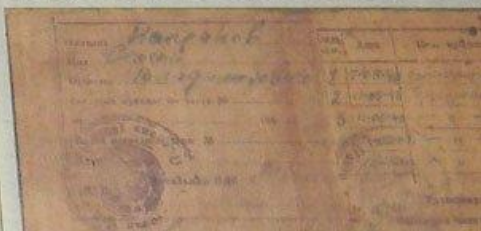
Копія свідчення парашютиста ВДВ Країни С.В.КАПРАНОВА, удостоєного в післявоєнні часи звання Героя Соціалістического Труду