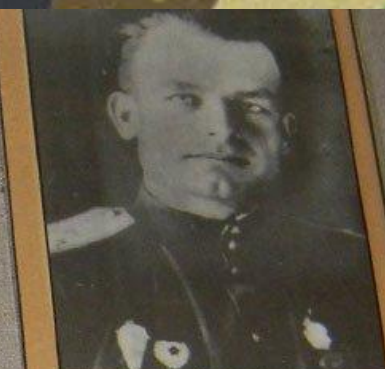
П.М. СИДОРЧУК – командир 5-й гв. воздушно-десантной бригады. Фото 1944 г.