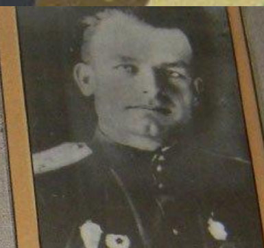
П.М. СИДОРЧУК – командир 5-й гв. воздушно-десантной бригады. Фото 1944 г.