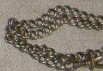
ЧАСИ карманні участника воздушного десанта на Днепре Ю.М.УХАБІНА