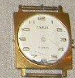
ЧАСИ участника воздушного десанта на Днепре ШЕВЧУКА В.Г.