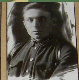
В.К. ГОНЧАРОВ – Командир 3-й гв. воздушно-десантной бригады. Фото 1935 г.