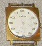
Часы участника воздушного десанта на Днепре ШЕВЧУКА В.Г.