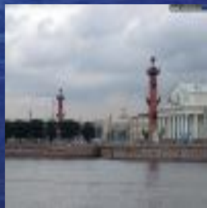
Ростральные колонны Тома де Томон