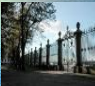
Решетка Летнего сада Фельтен

Назови название архитектурного памятника и его автора