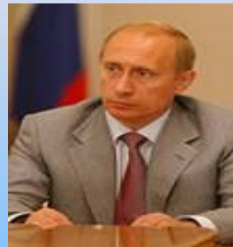
Владимир Владимирович Путин - второй президент России (2000-2008)