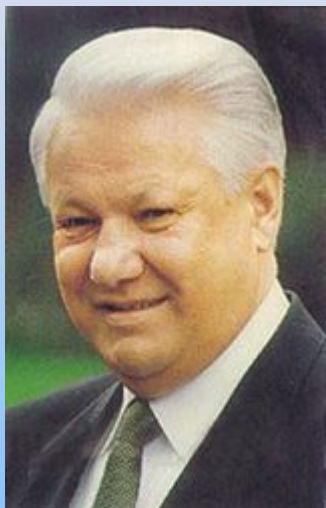
Первый президент России (1991-1999)

Президент РФ- высшая государственная должность Российской Федерации, а также лицо, избранное на эту должность. Президент России является главой государства