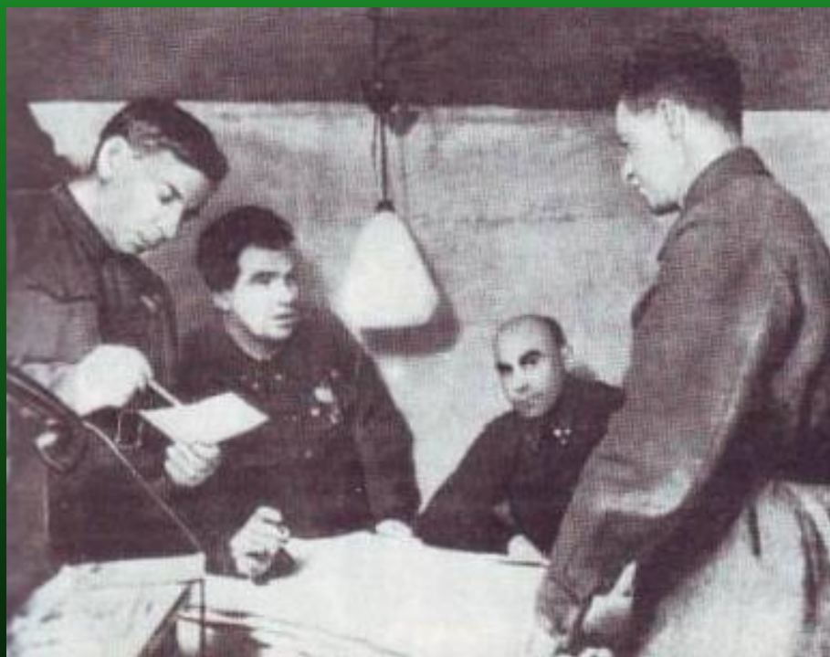
В штабе 62-й армии: Н.И.Крылов, В.И. Чуйков, К.А.Гуров, А.И.Родимцев

17 июля 1942 года передовые части фашистской группы армий «Б» в большой излучине Дона встретились с войсками Сталинградского фронта. Началась Сталинградская битва.