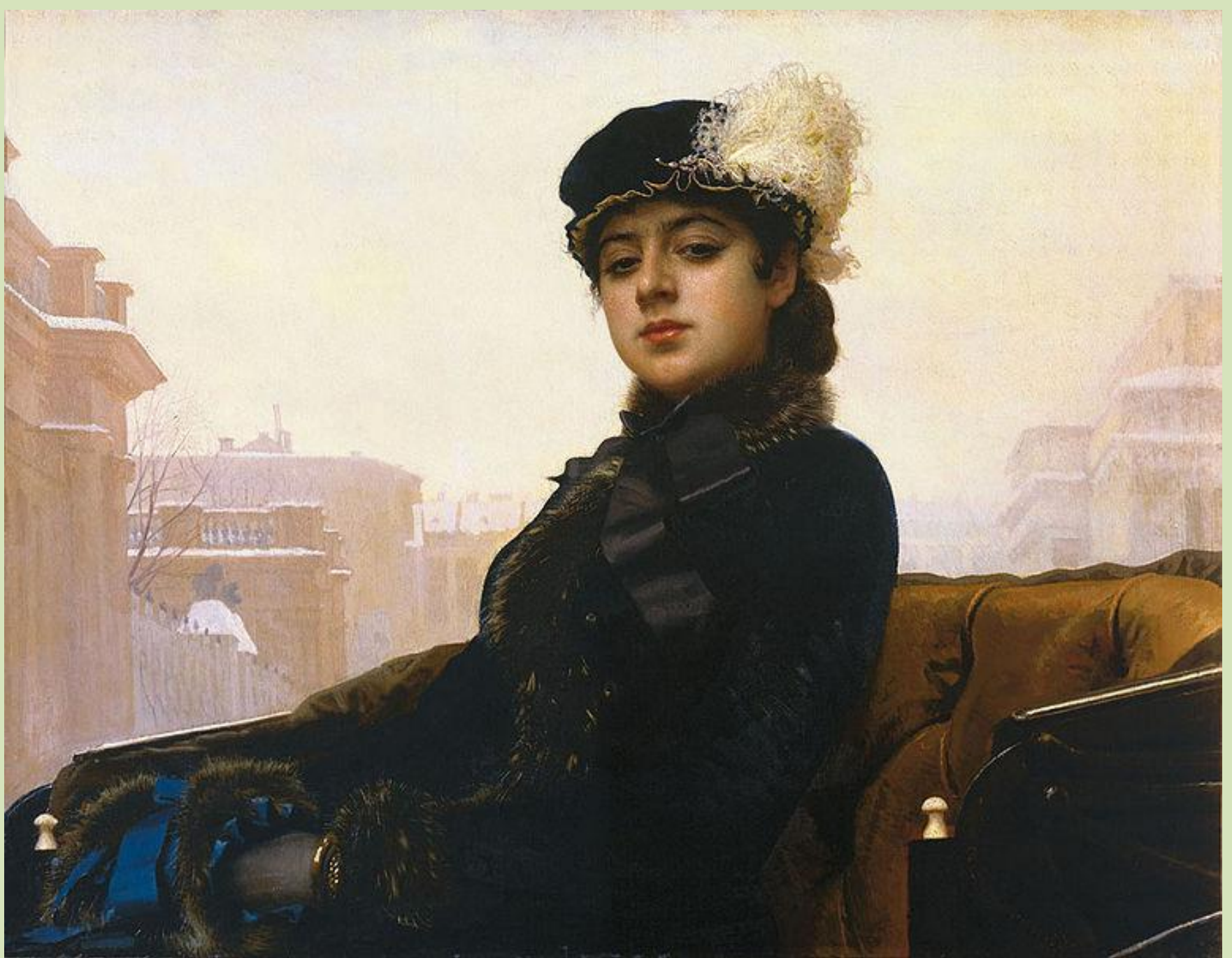
«Неизвестная» — картина русского художника Ивана Крамского