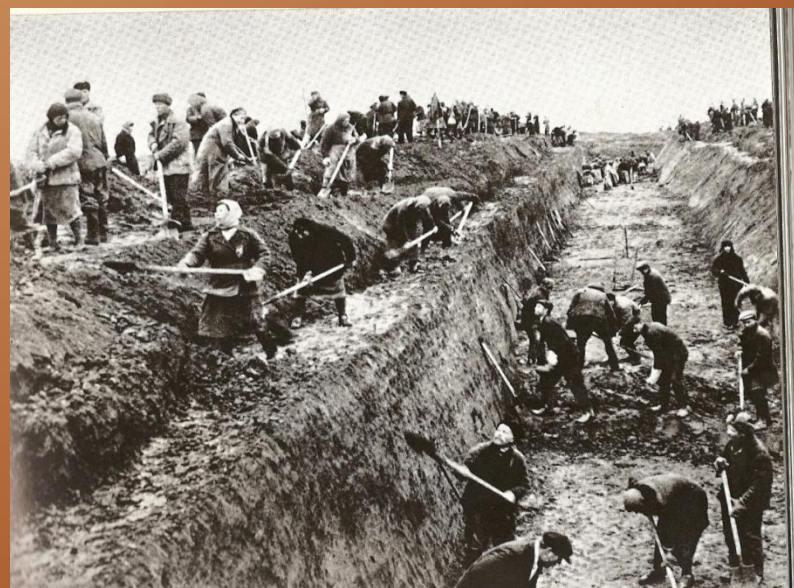
Жители Москвы на строительстве оборонительных рубежей