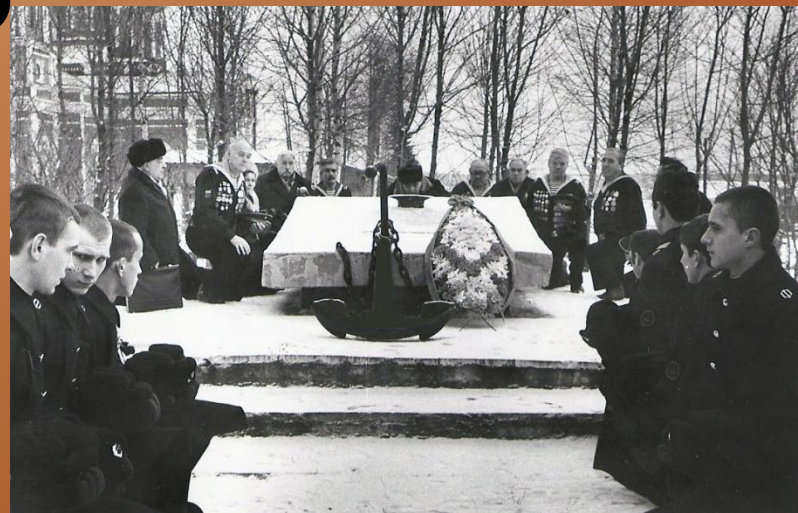
п. Белый Раст