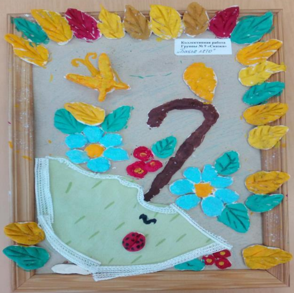
Коллективная работа Группы № 9 «Сказки» «Летнее чудо»