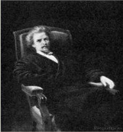
А. К. Бруни

Проект зданий Университета был выполнен петербургским академиком архитекторы А. К. Бруни и творчески воплощен томским архитектором П. П. Нарановичем .