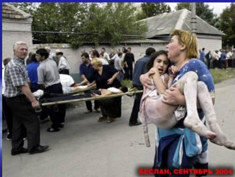
БЕСЛАН, СЕНТЯБРЬ 2004

Почти все школьники были в майках и трусиках – в школе была страшная жара. Несмотря на шок, первое, что просили дети, - пить.