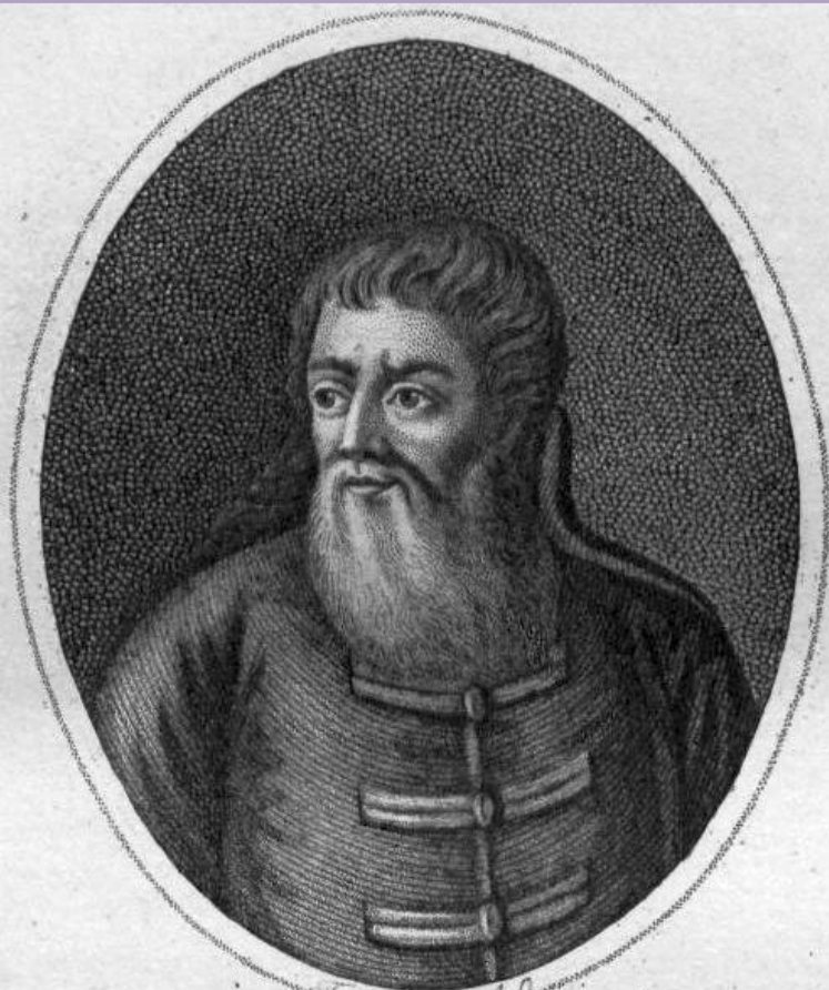
Никита Моисеевич Зотовъ, Наставникъ Царевича Петра Алексеевича