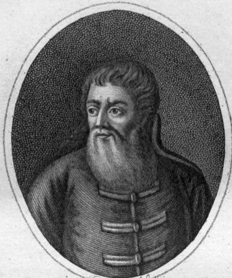
Никита Моисеевич Зотовъ, Наставникъ Царевича Петра Алексеевича