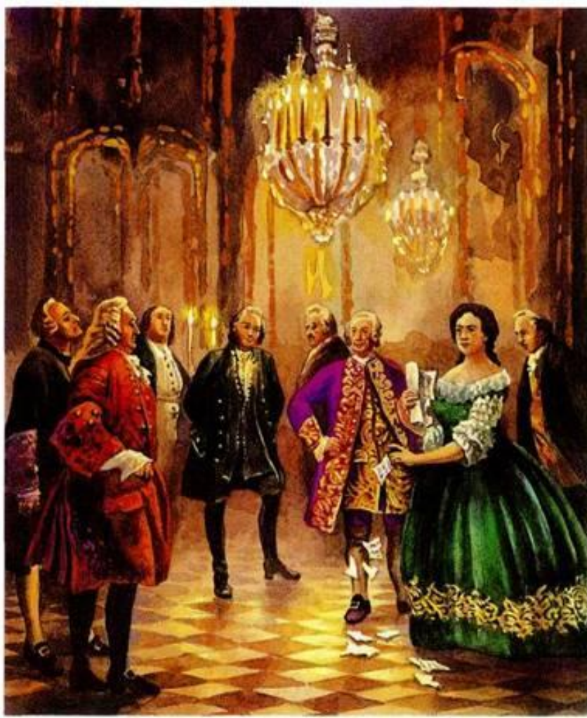
Анна рвёт Концессии.

Придя к власти, Анна ликвидировала Верховный тайный совет, заменив его Кабинетом министров, который, в сущности, управлял страной. Также была учреждена Канцелярия тайных розыскных дел, которая в короткий срок набрала огромную силу, так как Анна постоянно боялась заговоров,