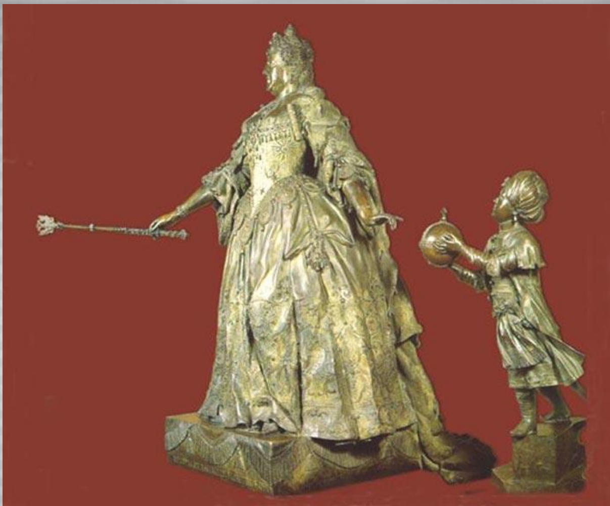
Русский музей. Анна Иоанновна с арапчонком. Растрелли.