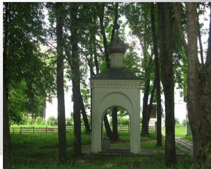
Часовня памяти погибших воинов.