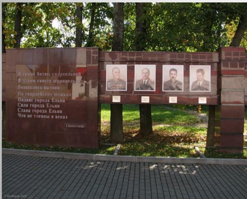
Аллея командиров первых Гвардейских полков