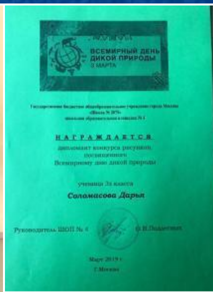
Конкурс рисунков «Всемирный день дикой природы»