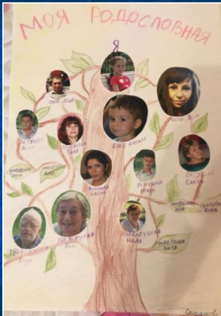
Проект «Моя родословная»