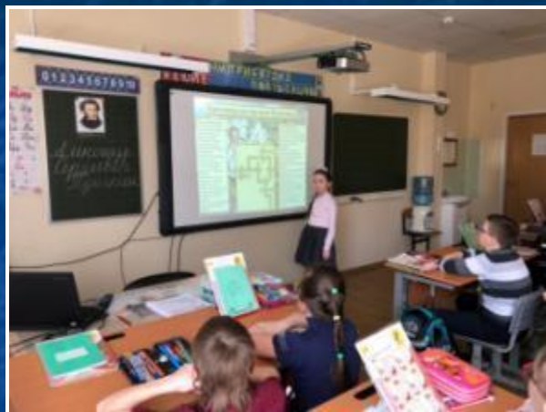
Викторина по сказкам А.С. Пушкина