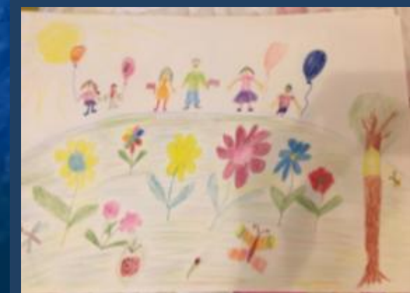
Конкурс «Живая планета»