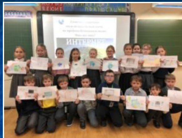
Конкурс «Что же это, интернет?»