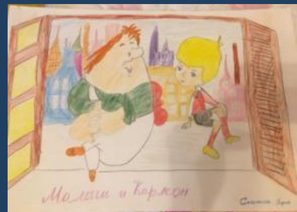
Конкурс «Любимые сказки»