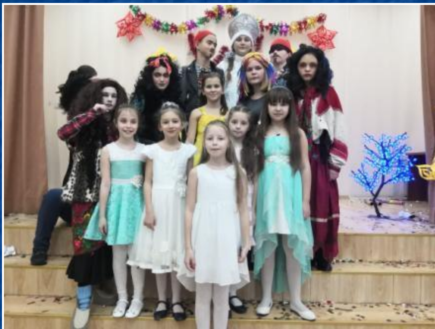
Театральная студия «Зеркало»

Я люблю заниматься, развиваться и никогда не стою на месте, пробую себя в различных направлениях, хожу на дополнительные занятия.