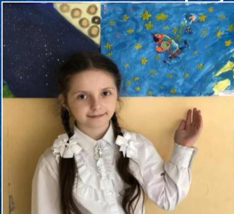
Конкурс «Ближе к звёздам»