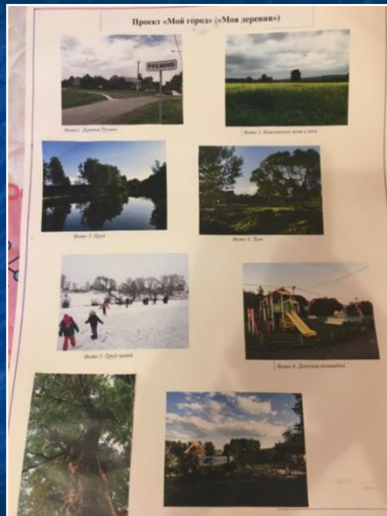
Проект «Мой город» («Моя деревня»)