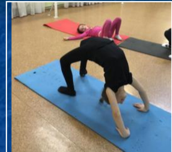
Занятия в ДК «Солнечный»