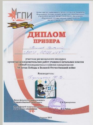
Призер межрегионального конкурса проектно-исследовательских работ «Юный исследователь», 2015