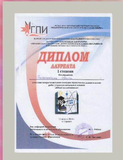
Победитель межрегионального конкурса проектно-исследовательских работ «Юный исследователь», 2014