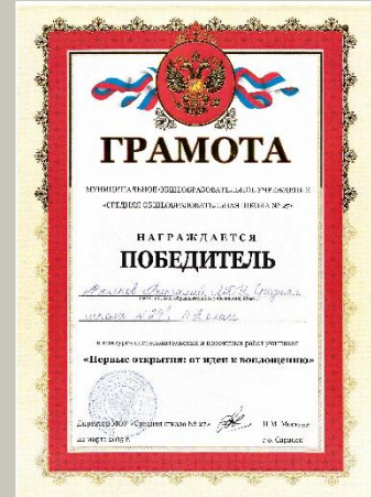
Победитель конкурса исследовательских работ и проектов «Первые открытия: от идеи к воплощению», 2015