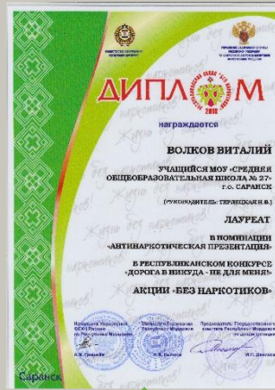
Призёр республиканского конкурса социальных антинаркотических роликов и презентаций «Дорога в никуда - не для меня!», 2013