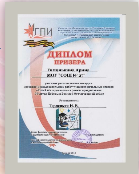
Призёр межрегионального конкурса проектно-исследовательских работ «Юный исследователь», 2015