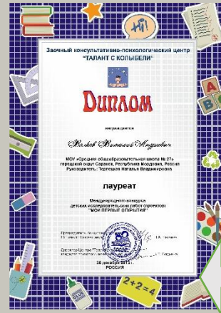
Лауреат международного конкурса детских исследовательских работ «Мои первые открытия», 2014