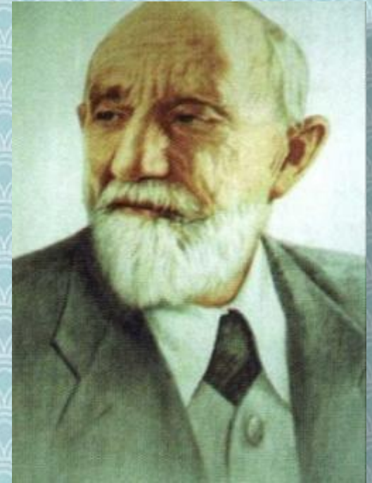
И.В. Мичурин - русский биолог и селекционер, автор многих сортов плодово-ягодных культур

Вопрос: Какие еще улицы нашего города носят имена известных ученых, писателей и поэтов? (Улица Лермонтова, улица Островского)