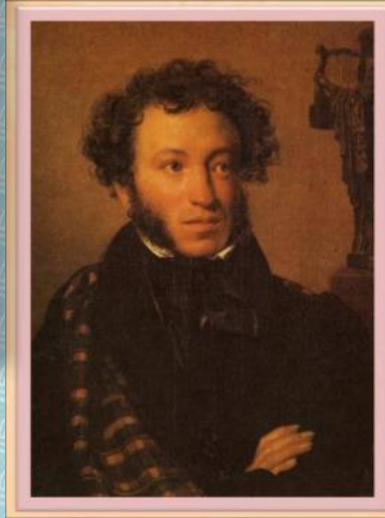
А.С. Пушкин –русский поэт

Улица Репина Улица Пушкина Улица Мичурина