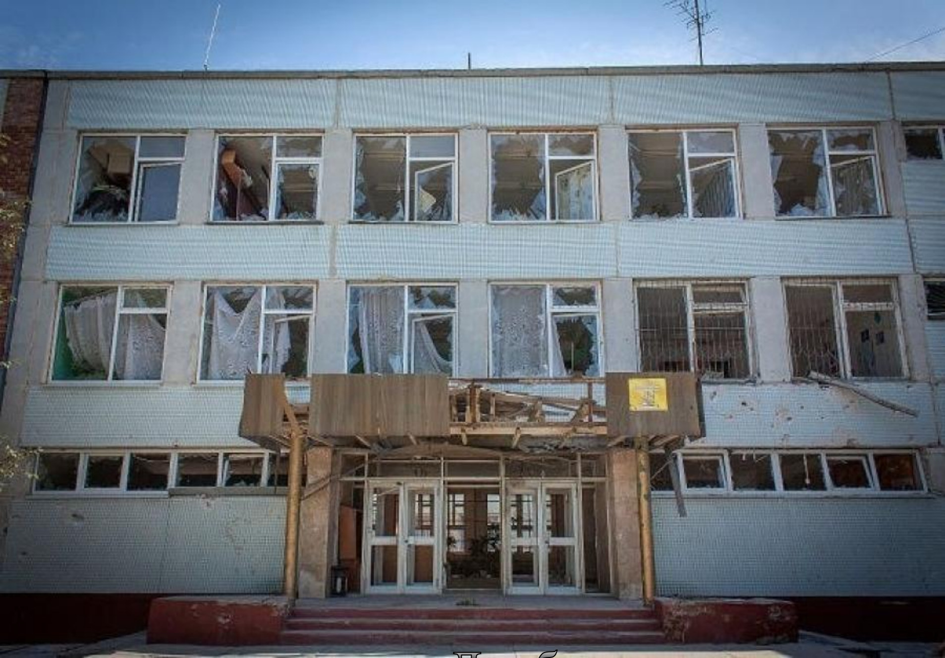
школа в Донбасе