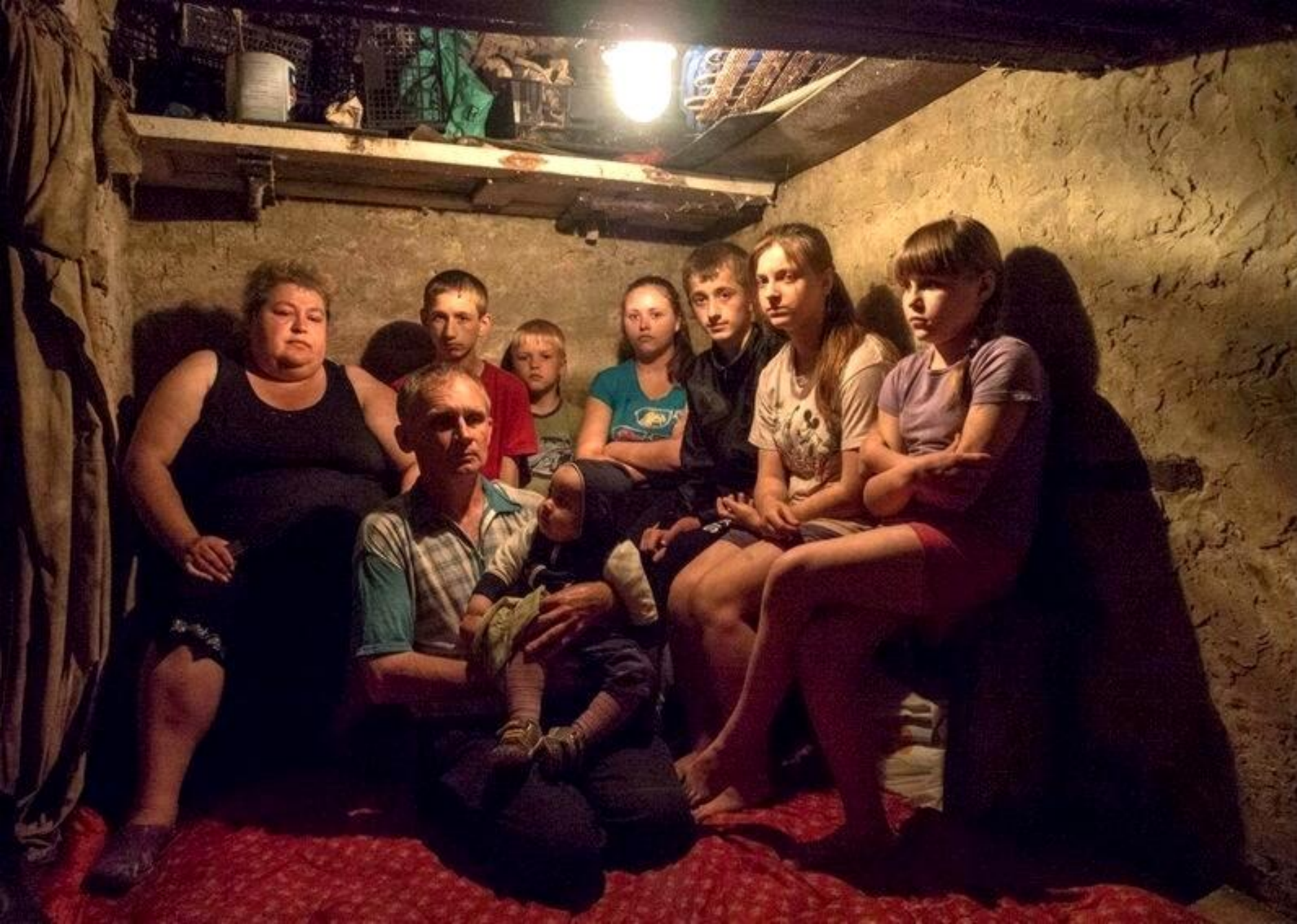
Люди прячутся в подвалах