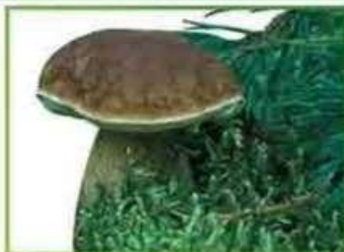
белый гриб (сосновый)