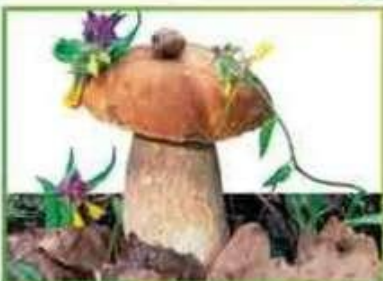
белый гриб (еловый)