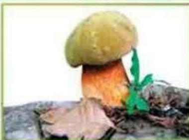
белый гриб (дубовый)