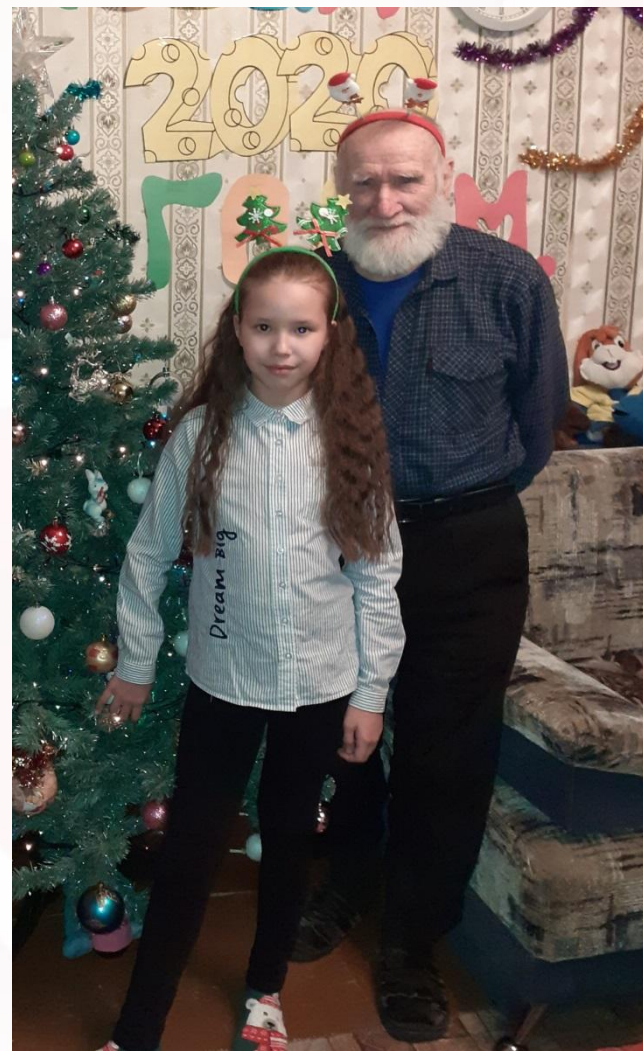
Я с дедом, 2020 год

Долг каждого из нас – помнить уроки страшной войны, беречь в памяти историю семьи.