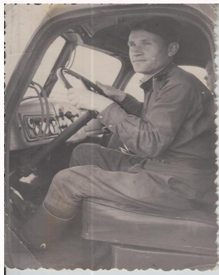
Служба в армии, г. Горький