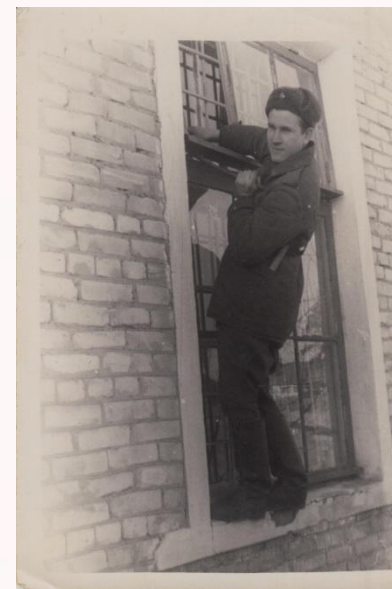
Служба в армии, г. Горький Ремонт окон хим. цеха