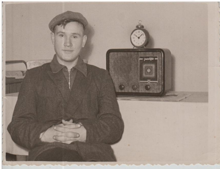
Харьковская строительная школа № 4

После окончания 7 классов, дед поступил в Харьковскую строительную школу № 4. Затем работал в 3-й Харьковской дистанции пути Южной железной дороги. Приехав с командировки, получил повестку в армию. С 1960 по 1963 годы служил в армии в г. Горький старшим мастером по ремонту и хранению химической техники и имущества.