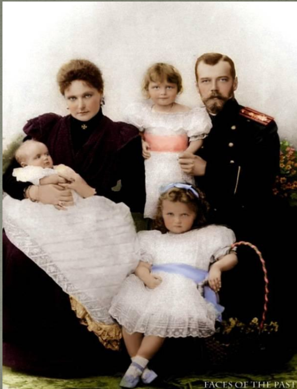
FACES OF THE PAST