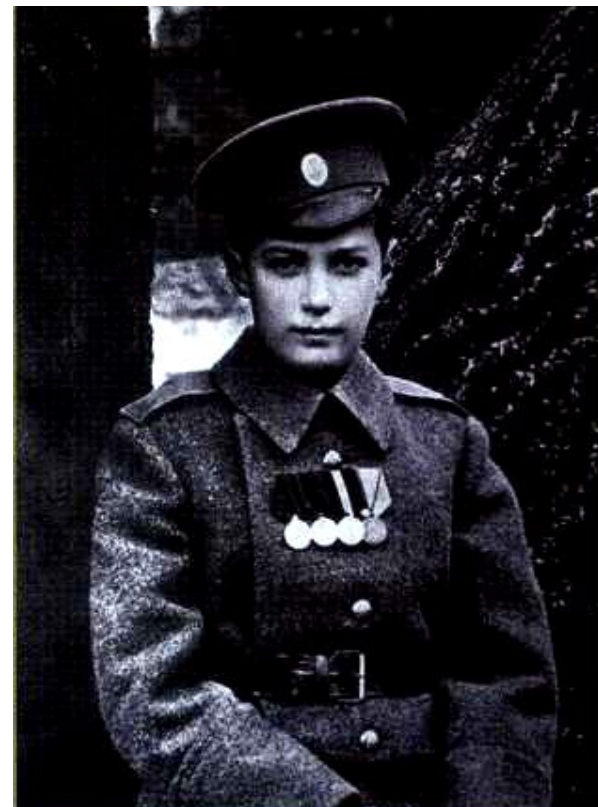
Цесаревич Алексей на фронте. Первая мировая война.