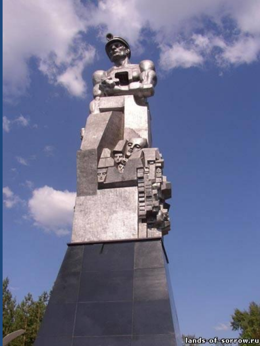
Монумент "Память шахтёрам Кузбасса"