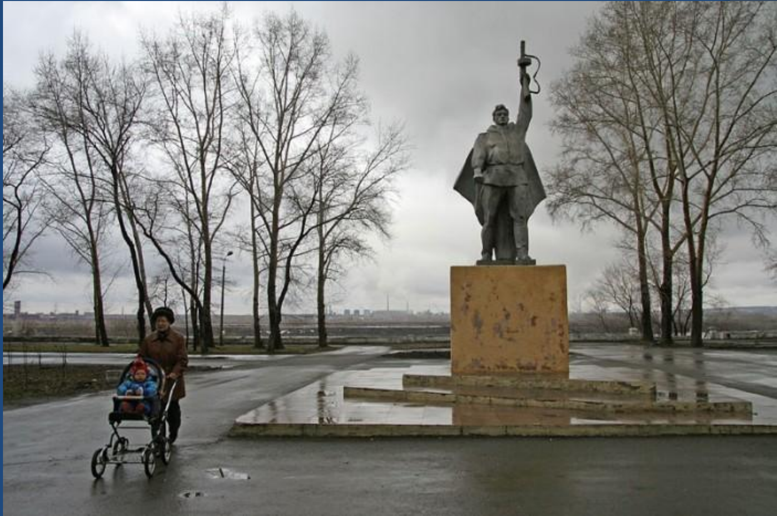
Памятник «Победы» в Кировском районе