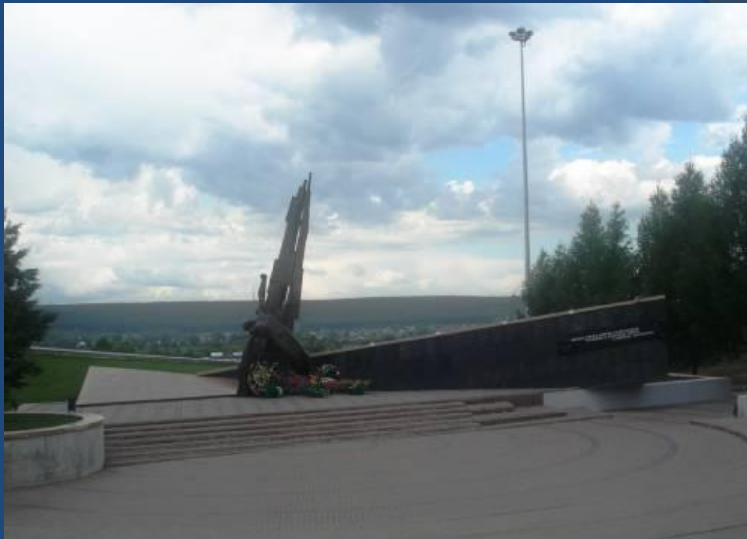
Памятник воинам- интернационалистам.