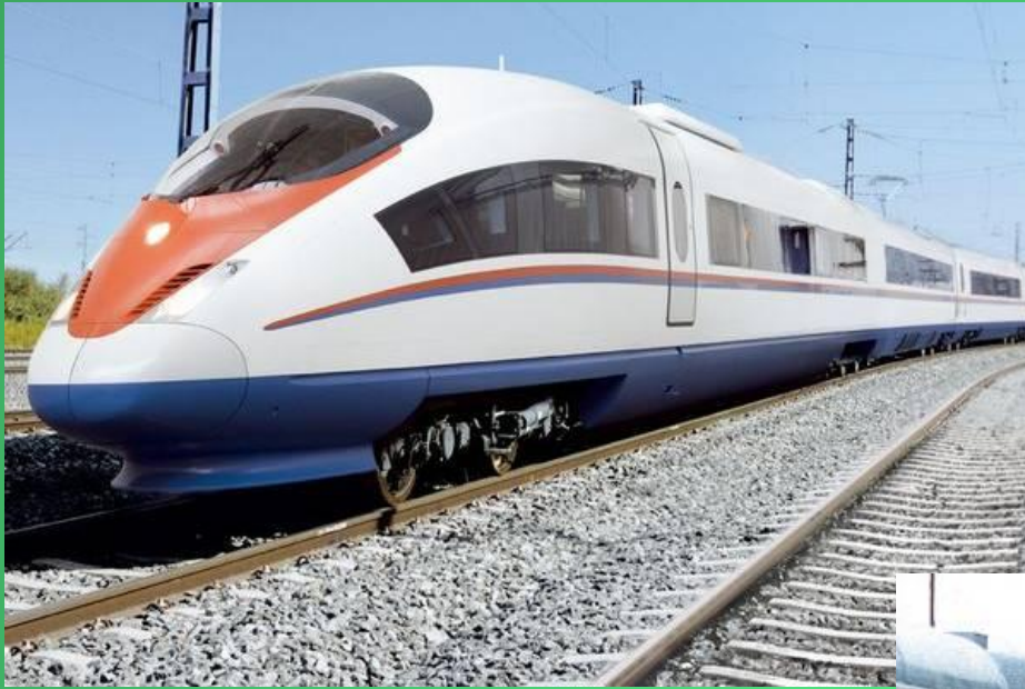
Поезд дальнего следования