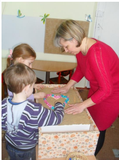
ИГРЫ С ПЕСКОМ