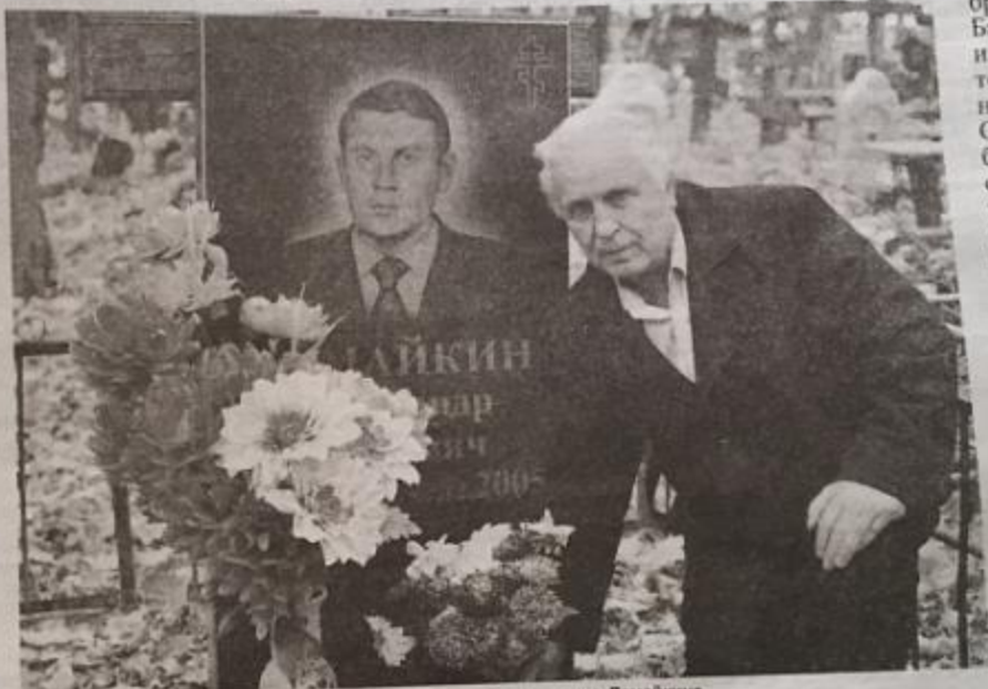
Цветы к надгробью Героя Советского Союза Ивана Самсоновича Лемайкина.

Но штабу 65-ой армии нужен был «язык», и его необходимо было добыть любой ценой. И вот он появился, вражеский часовой. 15 октября 1943 года шел дождик. На голове часового был капюшон. Он стоял с автоматом наперевес. Иван Сам-