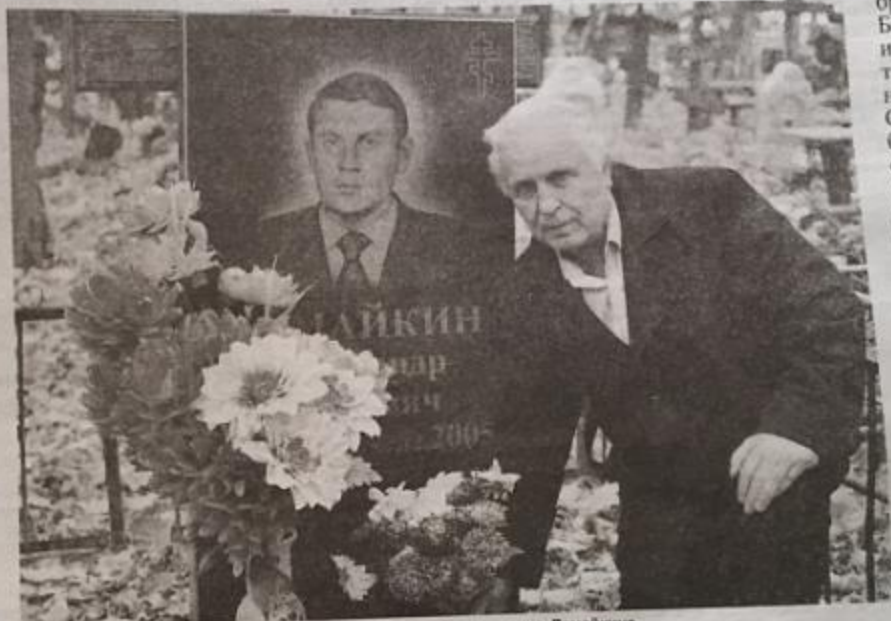
Цветы к надгробью Героя Советского Союза Ивана Самсоновича Лемайкина.

Но штабу 65-ой армии нужен был «язык», и его необходимо было добыть любой ценой. И вот он появился, вражеский часовой. 15 октября 1943 года шел дождик. На голове часового был капюшон. Он стоял с автоматом наперевес. Иван Сам-