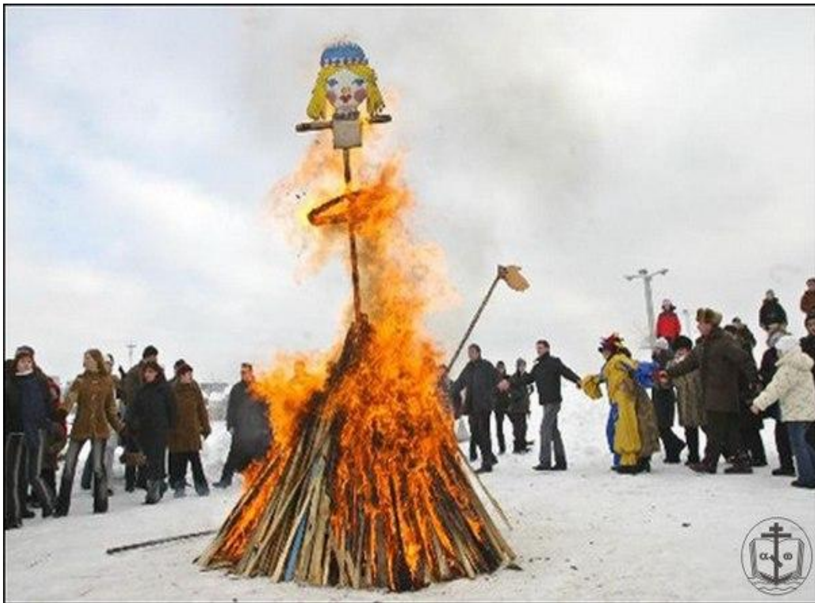
Сжигание чучела зимы