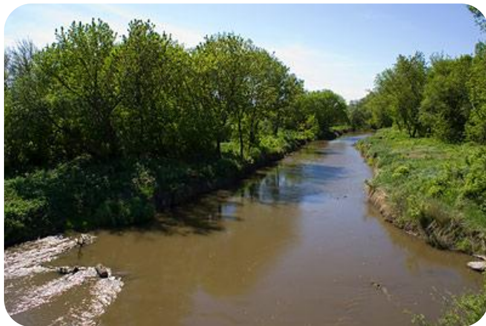
Река Кундрючья в районе станицы Нижнекундрюченской

Малые реки области – это единый организм бассейна реки Дон. На территории области протекает 165 малых рек общей протяженностью 9565 км, образующих 26 бассейнов. Для улучшения водохозяйственной обстановки, экологического оздоровления малых рек в области ведутся работы по расчистке русел, обустройству водоохраных зон, их облесению. Защита малых рек – одна из важнейших проблем в общей системе природоохранного комплекса.