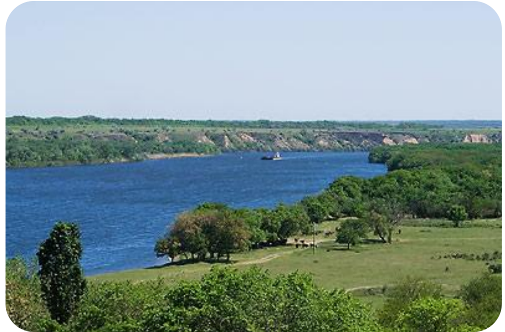
Северский Донец в нижнем течении

Северский Донец. Главный приток Дона (правый). Общая протяженность – 1053 км, протяженность по территории области – 280 км. Древнее название реки – Сиргис. На ростовской земле Северский Донец вбирает в себя слева Деркул, Калитвинец, Калитву, Быструю; справа – Большую и Малую Каменку, Лихую, Кундрючью. От устья до города Донецк Северский Донец судоходен. В устье находится порт Усть-Донецк.