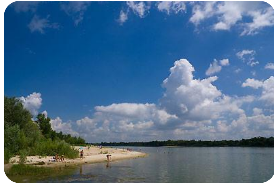
Дон в районе станицы Багаевской