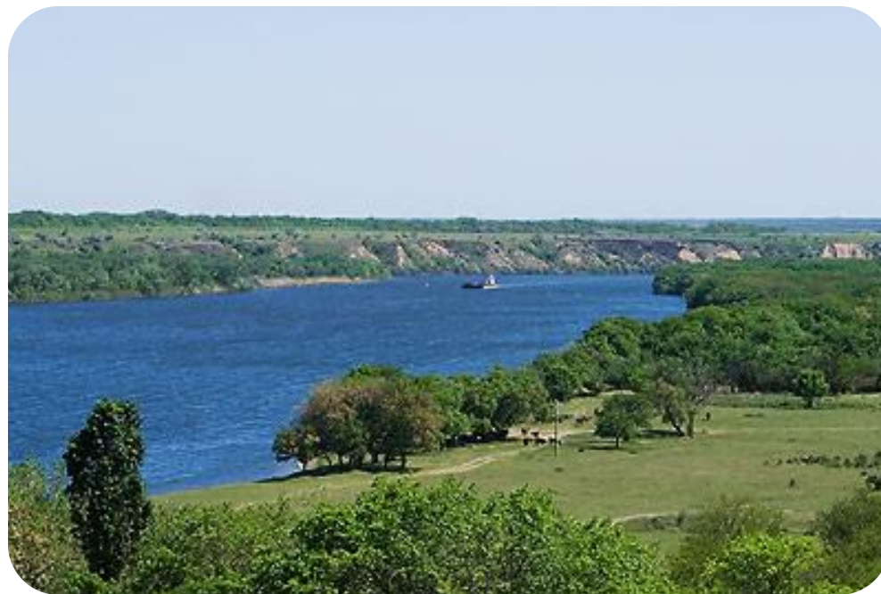
Северский Донец в нижнем течении

Северский Донец. Главный приток Дона (правый). Общая протяженность – 1053 км, протяженность по территории области – 280 км. Древнее название реки – Сиргис. На ростовской земле Северский Донец вбирает в себя слева Деркул, Калитвинец, Калитву, Быструю; справа – Большую и Малую Каменку, Лихую, Кундрючью. От устья до города Донецк Северский Донец судоходен. В устье находится порт Усть-Донецк.