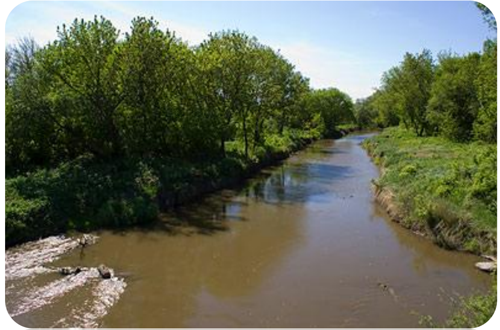
Река Кундрючья в районе станицы Нижнекундрюченской

Малые реки области – это единый организм бассейна реки Дон. На территории области протекает 165 малых рек общей протяженностью 9565 км, образующих 26 бассейнов. Для улучшения водохозяйственной обстановки, экологического оздоровления малых рек в области ведутся работы по расчистке русел, обустройству водоохраных зон, их облесению. Защита малых рек – одна из важнейших проблем в общей системе природоохранного комплекса.